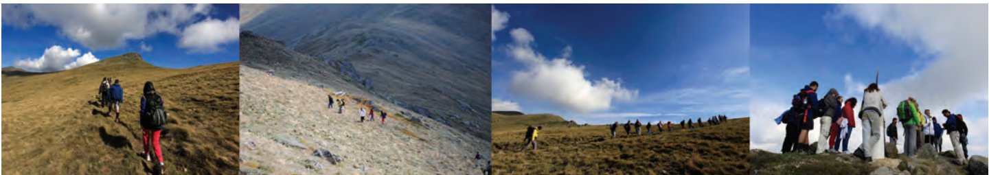
Γιάννης Ζιώγας / Land Arts of the American West / Χρήστος Ιωαννίδης Στάσεις συνόρων Όριζα / Μοσχοχώρι Φωτογραφία 2014