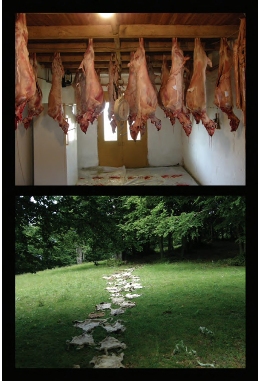
Κική Στούμπου, Μαρία Παπαλεξίου Ου( +-)τόπων αφηγήσεις Λάκκος Προβίες, 2011