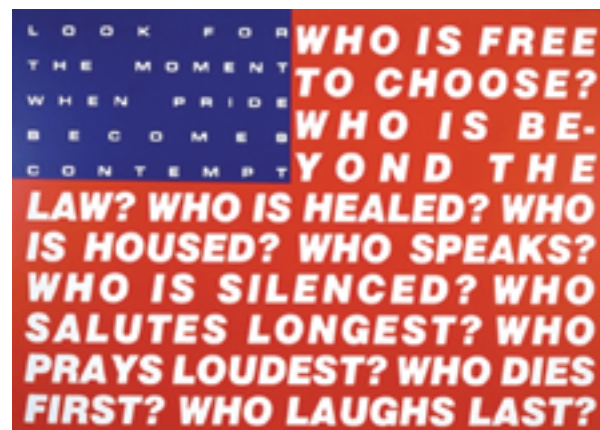
Εικόνα 10: Barbara Kruger, "Untitled" (Questions), 1991, Φωτογραφική μεταξοτυπία σε βινύλιο, Συλλογή Marieluise Hessel, Center For Curatorial Studies, Bard College, Annandale-On-Hudson, N.Yόρκη

επιμελητήρια από το 1996 έως το 2010. Στα τέλη Ιανουαρίου του 2003 διοργανώσα την έκθεση, Good Morning, America , η οποία εγκαινιάστηκε σε μια κατάμεστη αίθουσα υποδοχής. Ο τίτλος της έκθεσης, που προτείνει μια έκκληση αφύπνισης, υπογραμμίζοντας πως ευαισθητοποιημένοι καλλιτέχνες ανταποκρίθηκαν στη ζωή και την πολιτική των Ηνωμένων Πολιτειών στον απόηχο της 11 ης Σεπτεμβρίου. Τα έργα περιελάμβαναν έργα ζωγραφικής, γλυπτικής και εικονογραφημένα χειρόγραφα με μεικτά μέσα, εγκαταστάσεις με φωτογραφίες και κείμενα, καθώς και σε απευθείας συνδεδεμένα έργα βίντεο. Η έκθεση περιελάμβανε επίσης κάποια ιστορικά ηχηρά έργα, όπως η ερμηνεία της αμερικανικής σημαίας της Barbara Kruger, καθώς και τα έργα του International Center of Photography (Διεθνές Κέντρο Φωτογραφίας) και της National Coalition Against Censorship (Εθνική Συμμαχία κατά της λογοκρισίας) (εικ. 10).