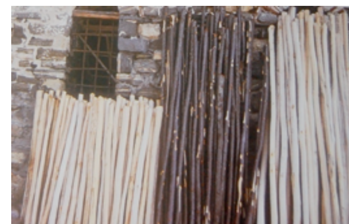
Εικόνα 2: Γιώργος Τσακίρης, Εγκατάσταση στο όρος Πάικο, 1985.

Αυτά τα έργα, στην Αθήνα και στο Πάικο, παρέμεναν αφετηριακές καταθέσεις, νεανικές, αλλά πολύ ουσιαστικές για τη μετέπειτα πορεία του, ως δίδυμα μανιφέστα ιδεών 121 . Το βασικότερο ίσως που θα πρέπει να κρατήσουμε από αυτή την προσέγγιση είναι ότι, για τον Τσακίρη,