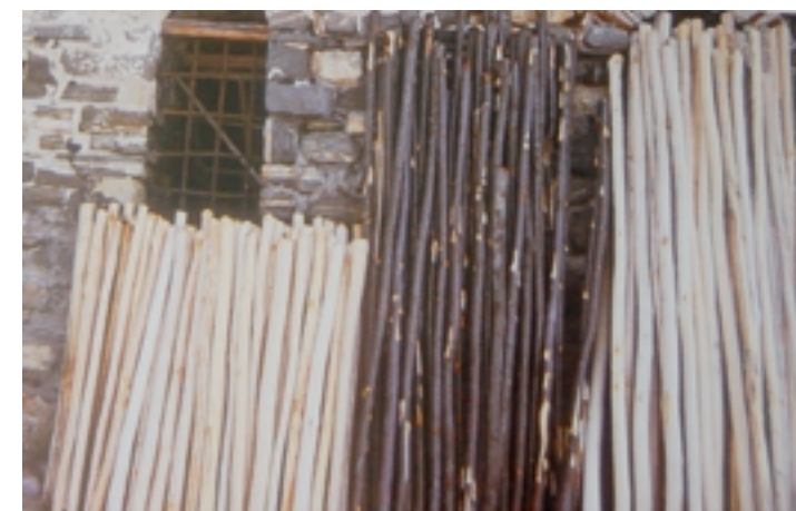
Εικόνα 2: Γιώργος Τσακίρης, Εγκατάσταση στο όρος Πάικο, 1985.

Αυτά τα έργα, στην Αθήνα και στο Πάικο, παρέμεναν αφετηριακές καταθέσεις, νεανικές, αλλά πολύ ουσιαστικές για τη μετέπειτα πορεία του, ως δίδυμα μανιφέστα ιδεών 121 . Το βασικότερο ίσως που θα πρέπει να κρατήσουμε από αυτή την προσέγγιση είναι ότι, για τον Τσακίρη,