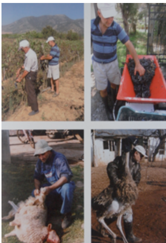
Εικόνα 4: Γιώργος Τσακίρης, Οικογενειακές Υποθέσεις, 2000.

Το φυσικό τοπίο, για τον Τσακίρη, δεν είναι το φυσικό τοπίο στην αφαιρετική του προσέγγιση, αλλά η εντοπιότητα του Πάικου και η περιοχή γύρω από αυτό. Επομένως όλα τα εικαστικά αντικείμενα και εικόνες που σχηματίζει ο Τσακίρης δεν είναι αποτυπώσεις ενός συστήματος, αλλά απόρροια μιας διαδικασίας έρευνας ενός οικείου χώρου. Κατά κάποιο τρόπο, το φυσικό τοπίο διερευνάται διότι είναι ο οικείος χώρος και αυτή είναι η σημαντική διαφορά του έργου του Τσακίρη από έργα άλλων καλλιτεχνών της Land Art (παλαιότερα) ή, πιο πρόσφατα, έργων της Environmental Art ή της Sustainable Art.