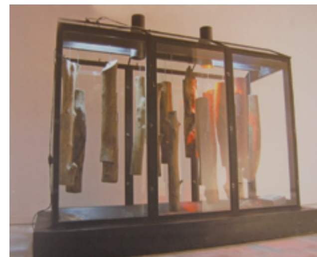
Εικόνα 5: Γιώργος Τσακίρης, Σαράκι, 300x255x130 εκ., σίδερο, γυαλί, νερό, ξύλο. Σαράκι, ηλεκτρικό φως, οροί, θερμαντικές αντιστάσεις μικροφωνική εγκατάσταση, 1983.

«Περιστερώνες» 127 , «Κλωσσομηχανή αριθμός 2» 128 , «Σκόρος» 129 , «Αλευρόψειρα» 130 αποτυπώνουν μια προσπάθεια όπου το βιωματικό, το τεχνητό και η αφαιρετική σχηματοποίηση συμβαδίζουν στη δημιουργία ενός καλλιτεχνικού παράγωγου. Τα έργα αυτά δημιουργούν Τεχνητές Φύσεις 131 , μικρές κοιτίδες ελεγχόμενων, κατά το δυνατόν, ενεργειών που προκύπτουν από τον τρόπο που πραγματοποιούνται στο φυσικό περιβάλλον (εικ. 5).