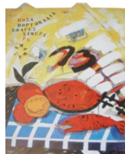
Εικόνα 1: Γιώργος Τσακίρης, Πόσα πορτοκάλια έφαγες σήμερα ρε μαλάκα, 195x44x2 εκ., ακρυλικό σε ξύλο, 1983.

αντικείμενα είχαν οργανωθεί με τρόπο που να μην απομνημονεύει μια αισθητική προσέγγιση και επίσης, στο δικό τους τόπο, σαν τα δείγματα μιας σειράς από συλλογισμούς, των οποίων το αντικείμενο θα ήταν η αντιπαράθεση, μας προγενέστερης φυσικής διάταξης σε σχέση προς τη διάταξη μιας καλλιτεχνικά, ιστορικής τους επεξεργασίας της διαδικασίας τους» 120 .