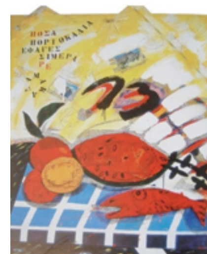
Εικόνα 1: Γιώργος Τσακίρης, Πόσα πορτοκάλια έφαγες σήμερα ρε μαλάκα, 195x44x2 εκ., ακρυλικό σε ξύλο, 1983.

αντικείμενα είχαν οργανωθεί με τρόπο που να μην απομνημονεύει μια αισθητική προσέγγιση και επίσης, στο δικό τους τόπο, σαν τα δείγματα μιας σειράς από συλλογισμούς, των οποίων το αντικείμενο θα ήταν η αντιπαράθεση, μας προγενέστερης φυσικής διάταξης σε σχέση προς τη διάταξη μιας καλλιτεχνικά, ιστορικής τους επεξεργασίας της διαδικασίας τους» 120 .