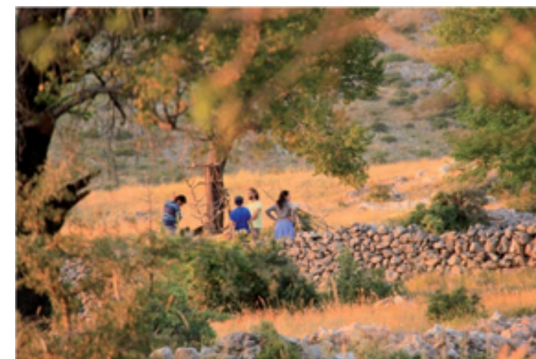
Εικόνα 5. Δραστηριότητες στο έρημο χωριό Μοσχοχώρι- Φωτογραφικό αρχείο Γιάννη Δαϊκόπουλου (2014).