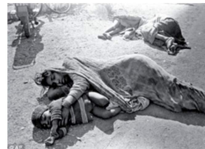
Εικόνα 1: Το ατύχημα της Bhopal, 3 Δεκεμβρίου 1984. http://www.dailymail.co.uk/news/article-1284623/7-men-jailed-1984-Bhopal-gas-tragedy-killed-15-000-people.html . Ανακτήθηκε στις 1-8-2015.