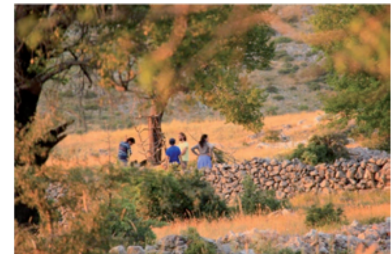
Εικόνα 5. Δραστηριότητες στο έρημο χωριό Μοσχοχώρι.