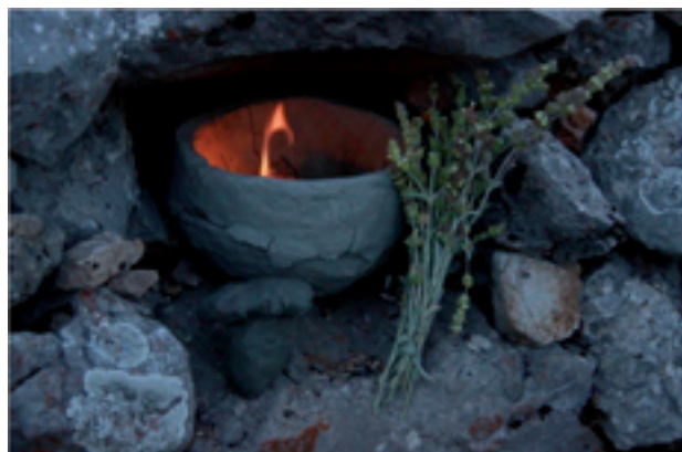
Εικόνα 6. Βωμός με αναθήματα στο έρημο χωριό Μοσχοχώρι- Φωτογραφικό αρχείο Γιάννη Δαϊκόπουλου (2014).

Επίσης, στις πορείες μέσα στα δάση ο φοιτητής πληροφορείται για τις διατροφικές και φαρμακευτικές ιδιότητες των φυτών και μανιταριών.