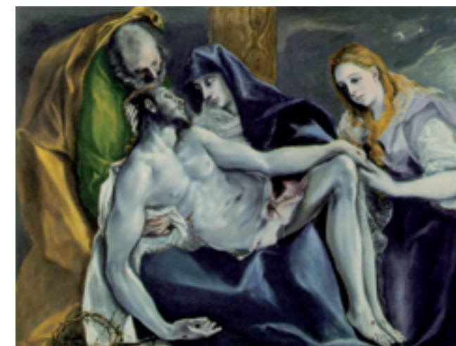
Εικόνα 2: El Greco, Πιετά, λάδι σε μουσαμά, 120x 145 εκ. Ιδιωτική Συλλογή, 1587-1597.