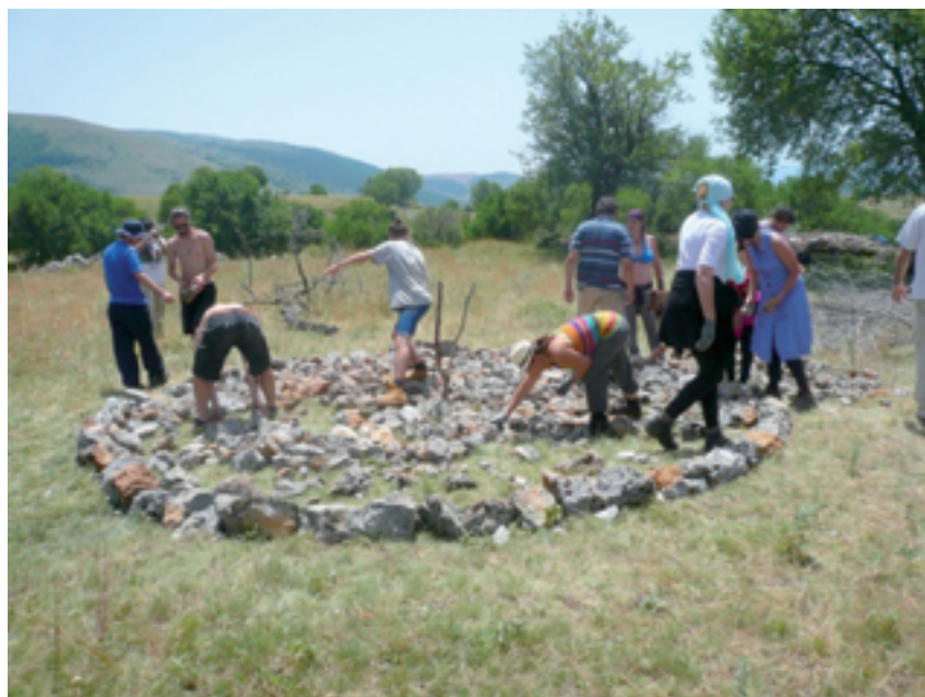
Εικόνα 4: Το πέτρινο αλώνι της μνήμης χρειάζεται φροντίδα

Μόλις εξαντληθούν οι διάσπαρτοι λίθοι στο σημείο συλλογής, η αλυσίδα στρέφεται γύρω από το κέντρο, συνεχίζοντας την αξιοποίηση των διάσπαρτων σε άλλο σημείο. Το «αλώνι μας» ολοκληρώνεται, όλα τα κενά γεμίζουν. Τακτοποιούμε τους λίθους: τα μεγάλα μεγέθη στην περίμετρο, στο εσωτερικό εναλλαγή μεγεθών και μορφών, θέλουμε το «ανθρώπινο χέρι» να αποτυπωθεί στοιχειωδώς και στην «φροντίδα της κατασκευής», όχι μόνο στην γεωμετρία (εικ. 4).