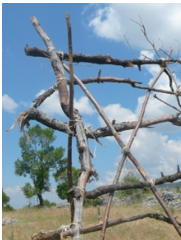
Εικόνα 5: Ζωντανά κλαδιά με δραματικές χειρονομίες σε εκφραστικές στάσεις.

μνημείο», το ισχυρότερο αρχιτεκτονικό στοιχείο μνήμης του τόπου. Κατά τον Adolf Loos 31 , οι μοναδικές κατηγορίες αρχιτεκτονήματος όπου αυτό μπορεί να αναχθεί σε καλλιτεχνική πράξη, είναι το Μνημείο και ο Τάφος.