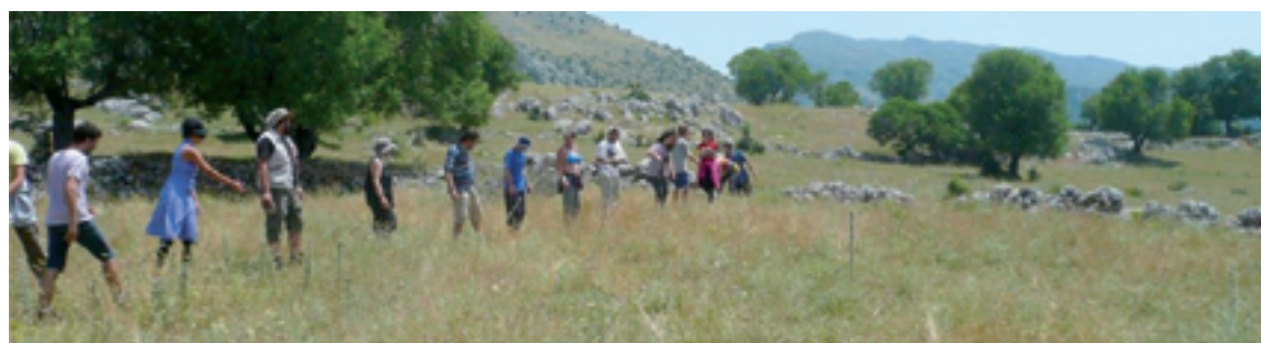
Εικόνα 3: Η ανθρώπινη αλυσίδα μεταφοράς λίθων και ανάκτησης μνήμης

Μόλις εξαντληθούν οι διάσπαρτοι λίθοι στο σημείο συλλογής, η αλυσίδα στρέφεται γύρω από το κέντρο, συνεχίζοντας την αξιοποίηση των διάσπαρτων σε άλλο σημείο. Το «αλώνι μας» ολοκληρώνεται, όλα τα κενά γεμίζουν. Τακτοποιούμε τους λίθους: τα μεγάλα μεγέθη στην περίμετρο, στο εσωτερικό εναλλαγή μεγεθών και μορφών, θέλουμε το «ανθρώπινο χέρι» να αποτυπωθεί στοιχειωδώς και στην «φροντίδα της κατασκευής», όχι μόνο στην γεωμετρία (εικ. 4).