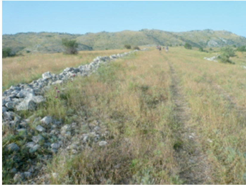
Εικόνα 1: Λίθινες γραμμές μέσα στο τοπίο