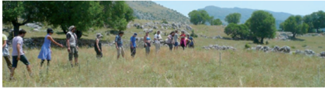
Εικόνα 3: Η ανθρώπινη αλυσίδα μεταφοράς λίθων και ανάκτησης μνήμης

Μόλις εξαντληθούν οι διάσπαρτοι λίθοι στο σημείο συλλογής, η αλυσίδα στρέφεται γύρω από το κέντρο, συνεχίζοντας την αξιοποίηση των διάσπαρτων σε άλλο σημείο. Το «αλώνι μας» ολοκληρώνεται, όλα τα κενά γεμίζουν. Τακτοποιούμε τους λίθους: τα μεγάλα μεγέθη στην περίμετρο, στο εσωτερικό εναλλαγή μεγεθών και μορφών, θέλουμε το «ανθρώπινο χέρι» να αποτυπωθεί στοιχειωδώς και στην «φροντίδα της κατασκευής», όχι μόνο στην γεωμετρία (εικ. 4).