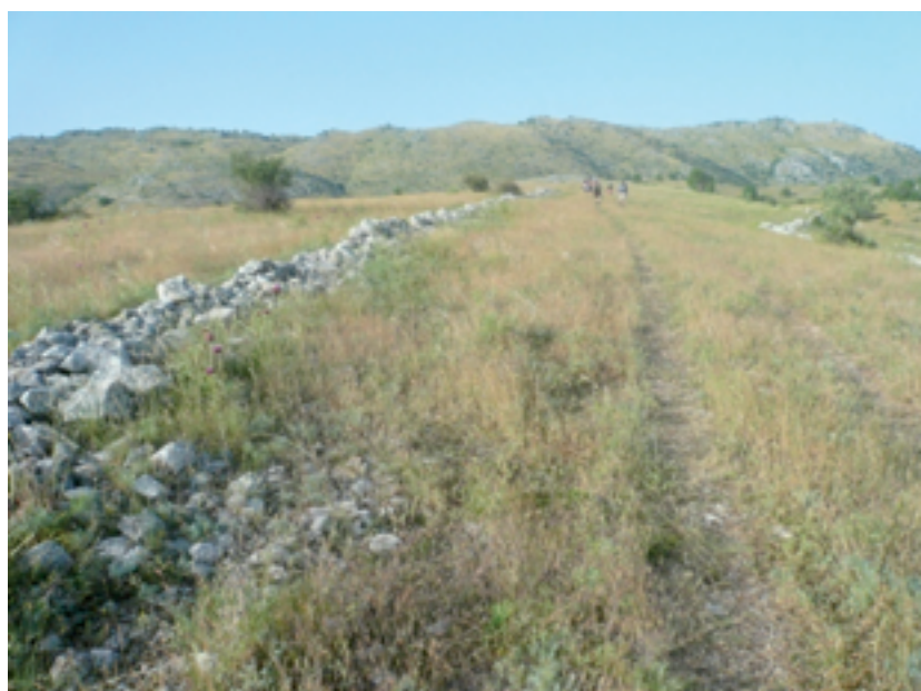
Εικόνα 1: Λίθινες γραμμές μέσα στο τοπίο