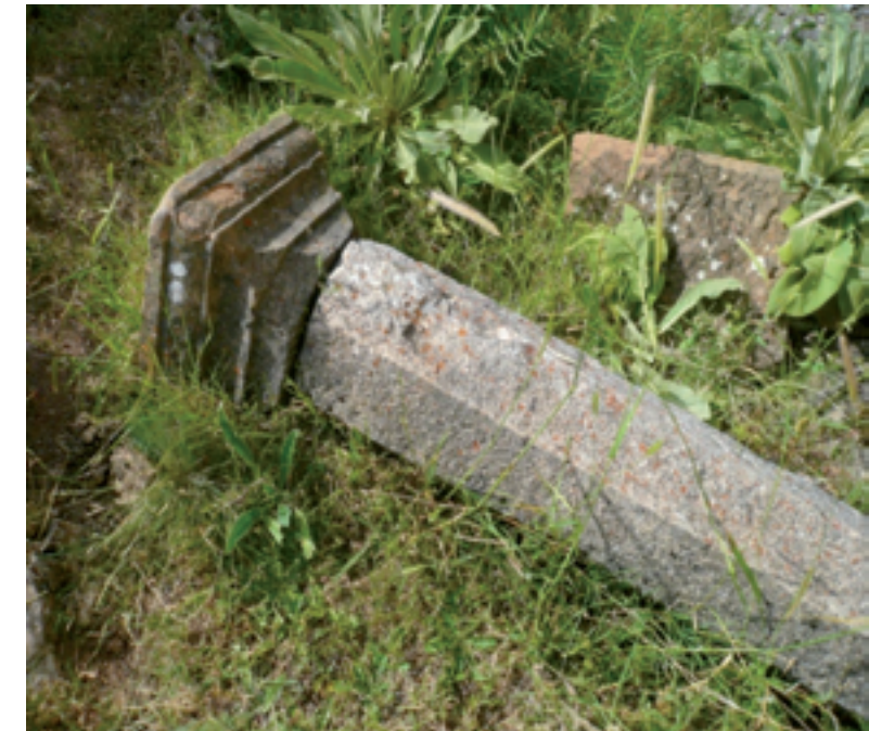
Εικόνα 2: Εδώ κείται ένας απολιθωμένος άνθρωπος

του κιονίσκου, όπου μας αποκαλύπτεται ότι οι ντόπιοι κατείχαν την γνώση μιας τεχνολογικής λεπτομέρειας που ανάγεται στην αρχαιοελληνική κλασική ναοδομία.