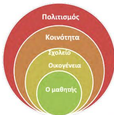
Εικόνα 3. Οικοσυστημικοί παράγοντες σχολικού εκφοβισμού (Πηγή: Επιμορφωτικό υλικό Δικτύου για στελέχη εκπαίδευσης και εκπαιδευτικούς)

Τέλος, στο ρυθμιστικό πλαίσιο του 2023 οι εκτενείς αναφορές στους ρόλους και τις ενέργειες του ίδιου του Υπουργείου Παιδείας, των φορέων και των υπηρεσιών του (πίνακας 4) καταδεικνύουν την πρόθεση οργάνωσης της επίδρασης του εξωσυστήματος στο μικροσύστημα της σχολικής κοινότητας και στο μεσοσύστημα σχολείου και οικογένειας ή τοπικής κοινότητας. Οι φορείς και οι υπηρεσίες των Υπουργείων συντονίζουν, εποπτεύουν και ελέγχουν διαδικασίες, αποτελέσματα και συνεργασίες. Η νέα ψηφιακή πλατφόρμα αναφορών και καταγγελιών, ως ένας έμμεσος τρόπος επικοινωνίας με το διοικητικό εξωσύστημα, διαχέει αυτομάτως το περιεχόμενο της αναφοράς/καταγγελίας μαθητών/τριών και των οικογενειών τους σε τετραμελείς επιτροπές, οι οποίες όχι μόνο δεν ανήκουν στην άμεση σχολική κοινότητα, αλλά μπορούν να υποκαταστήσουν και τον εκπαιδευτικό ρόλο σε περίπτωση που «[...] παρατηρείται καθυστέρηση [...] ή σημειώνεται αδυναμία επίλυσης [...]» (άρθρο 8, Ν. 5029/2023). Η επιμόρφωση εδώ επισημαίνεται κυρίως ως αρμοδιότητα του Ινστιτούτου Εκπαιδευτικής Πολιτικής (άρθρο 11, Ν. 5029/2023) παρά ως μέσο ενδυνάμωσης των εκπαιδευτικών ή άλλων ενηλίκων, ενώ οι αναφορές σε