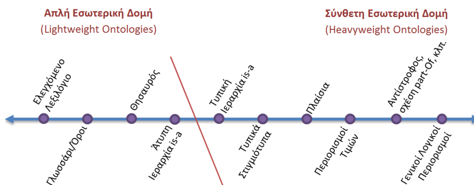
Εικόνα 2. Τύποι δομών αναπαράστασης γνώσης

Οι οντολογίες αποτελούν ένα από τα πιο πρόσφατα συστήματα και αναπτύσσονται κυρίως στο πλαίσιο του Σημασιολογικού Ιστού ως ειδικά μοντέλα εννοιών. Αναπαριστούν πολύπλοκες σχέσεις ανάμεσα σε αντικείμενα και περιλαμβάνουν κανόνες και αξιώματα ενώ περιγράφουν τη γνώση ενός συγκεκριμένου τομέα. Ειδικότερα, βασικό γνώρισμα της οντολογίας είναι ότι επιτρέπει τον ορισμό ενός πλούσιου δικτύου σημασιολογικών σχέσεων (semantic relationships), γεγονός που την καθιστά ισχυρότερη των θησαυρών αλλά και άλλων συστημάτων διαχείρισης και οργάνωσης γνώσης. Μια κατηγοριοποίηση των δομών αναπαράστασης γνώσης, όπως αναφέρεται στο (Lassila & McGuinness, 2001) φαίνεται στην Εικόνα 2.