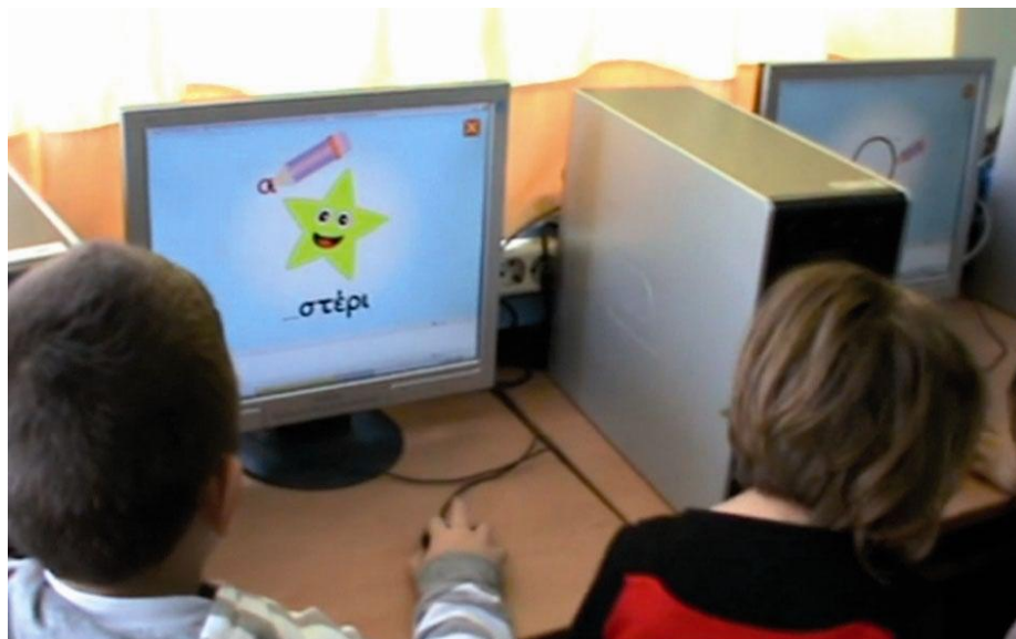
Εικόνα 7: Χρήση του διαδραστικού περιβάλλοντος μάθησης «Ένα Γράμμα Μια Ιστορία» στο εργαστήριο Η/Υ