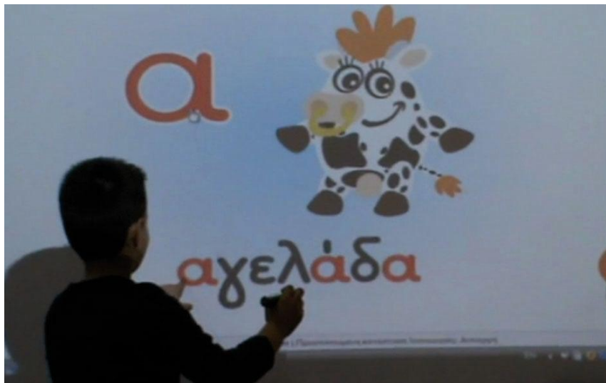
Εικόνα 4: Χρήση του διαδραστικού περιβάλλοντος μάθησης «Ένα Γράμμα Μια Ιστορία» στην τάξη (διαδραστικός πίνακας)