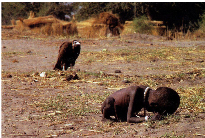
ΕΙΚ.3. Kevin Carter. Το παιδί και ο γύπας , 1993.

«Έχω κατάθλιψη... χωρίς τηλέφωνο... λεφτά για νοίκι... λεφτά για υποστήριξη παιδιών... λεφτά για χρέη... λεφτά!!!... Με στοιχειώνουν οι ζωντανές αναμνήσεις θανάτων και πτωμάτων και θυμού και πόνου... αναμνήσεις παιδιών που λιμοκτονούν ή είναι τραυματισμένα, τρελών πολεμάρχων, δολοφόνων εκτελεστών...».