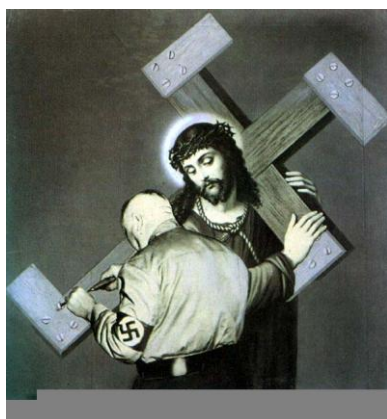
ΕΙΚ.1. John Heartfield, «Ο σταυρός δεν ήταν πολύ βαρύς!!», 1936.

Στην εικόνα 1 2 , βλέπουμε το Χριστό συντετριμμένο και ταπεινωμένο, να κρατά το σταυρό του μαρτυρίου του και να οδεύει προς το Γολγοθά, όπου θα σταυρωθεί. Την πορεία αυτή προς το θάνατο διακόπτει η παρουσία ενός ένστολου ναζί, ο οποίος καρφώνει στα άκρα του σταυρού κομμάτια ξύλου για να σχηματίσει τη σβάστικα!!! Ενδιαφέρον έχει και το κείμενο που συνοδεύει την εικόνα: «Ο σταυρός δεν ήταν πολύ βαρύς!!!»... Το σαρκαστικό αυτό σχόλιο που φαίνεται να συνοδεύει την πράξη του ναζί, αναδεικνύει με τρόπο συμβολικό το μέγεθος της θηριωδίας της ναζιστικής Γερμανίας, η οποία χρησιμοποιώντας γελοίες προφάσεις προβαίνει χωρίς δισταγμό σε κτηνώδεις πράξεις. Παράλληλα όμως, βλέπουμε το χιούμορ και την ευρηματικότητα του καλλιτέχνη, ο οποίος με απίστευτη αμεσότητα καταφέρνει να αποκαλύψει στο κοινό τις πιο τραγικές αλήθειες.