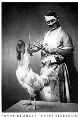
ΕΙΚ.2. John Heartfield, « Μην ανησυχείς! Είναι χορτοφάγος!! », 1936.

Στην εικόνα 2 3 , βλέπουμε το Χίτλερ ντυμένο χασάπη να κοιτάζει με βουλιμία τον περήφανο κόκορα-σύμβολο των λαών της Ευρώπης- που βρίσκεται μπροστά του και περπατά με καμάρι χωρίς να βλέπει τι προετοιμάζεται να γίνει πίσω από την πλάτη του. Ο Χίτλερ ακονίζει με ζήλο ένα μεγάλο μαχαίρι και ετοιμάζεται να τον αποκεφαλίσει και στη συνέχεια να τον καταβροχθίσει χωρίς οίκτο. Τα σχόλια του καλλιτέχνη, στο κάτω μέρος της εικόνας, κάθε άλλο παρά εφησυχάζουν το θεατή, αλλά και το υποψήφιο θύμα του: « Μην ανησυχείς! Είναι χορτοφάγος!!!! ». Βέβαια, το λαίμαργο βλέμμα του Αδόλφου δεν νομίζω ότι αφήνει κάποιο περιθώριο να αμφισβητήσουμε τις σαρκοβόρες διαθέσεις του!