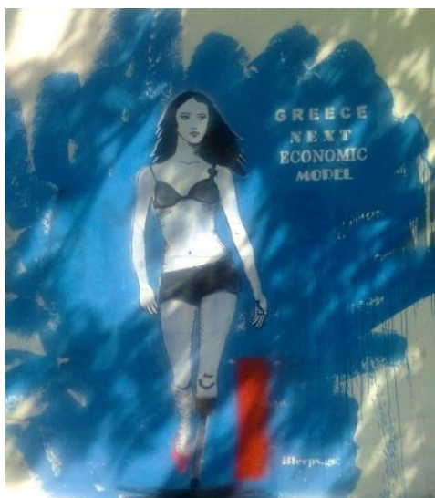
ΕΙΚ.5. Ελλάδα, το επόμενο οικονομικό μοντέλο , φωτογραφία Γιάννης Βέλλης.

Συχνά, τις εικόνες γκράφιτι στους τοίχους των αστικών κέντρων τις συνοδεύουν φράσεις που οι δημιουργοί τους τις διατυπώνουν με σκοπό να αστευτούν ή να περάσουν κάποιο πολιτικό ή κοινωνικό μήνυμα στον κόσμο, ακόμη να δηλώσουν την οργή ή την αγανάκτησή τους και πολύ συχνά τον έρωτά τους για κάποιο πρόσωπο! Όμως, στην περίπτωση μας θα επικεντρωθούμε σε ένα μήνυμα που αναδεικνύει με τον πιο συνοπτικό και σαρκαστικό τρόπο την εικόνα της Ελλάδας στη σύγχρονη ευρωπαϊκή πραγματικότητα. Η εικόνα 5 έχει τίτλο « Ελλάδα, το επόμενο οικονομικό μοντέλο » και παρουσιάζει μια όμορφη μελαχρινή κοπέλα, ντυμένη με τα εντελώς απαραίτητα, να κάνει πασαρέλα στη σύγχρονη πολιτική σκηνή με το ένα πόδι σε δεκανίκι. Η μετέωρη θέση της Ελλάδας στην παγκόσμια οικονομία και το ουτοπικό όραμα για αναίμακτη έξοδό της από την κρίση κυριαρχεί στη σκέψη του δημιουργού αυτού του ευφάνταστου έργου τέχνης που κοσμεί τους αθηναϊκούς δρόμους. Πρόκειται για την περίπτωση που η εικόνα και το κείμενο αλληλοσυμπληρώνονται με εύστοχο τρόπο και μόνο μαζί μπορούν να ερμηνευθούν με επιτυχία.