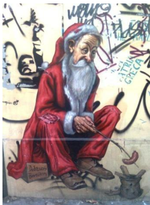
ΕΙΚ.4. Άδειος Βασίλης, φωτογραφία Γιάννης Βέλλης.

Συχνά, τις εικόνες γκράφιτι στους τοίχους των αστικών κέντρων τις συνοδεύουν φράσεις που οι δημιουργοί τους τις διατυπώνουν με σκοπό να αστευτούν ή να περάσουν κάποιο πολιτικό ή κοινωνικό μήνυμα στον κόσμο, ακόμη να δηλώσουν την οργή ή την αγανάκτησή τους και πολύ συχνά τον έρωτά τους για κάποιο πρόσωπο! Όμως, στην περίπτωση μας θα επικεντρωθούμε σε ένα μήνυμα που αναδεικνύει με τον πιο συνοπτικό και σαρκαστικό τρόπο την εικόνα της Ελλάδας στη σύγχρονη ευρωπαϊκή πραγματικότητα. Η εικόνα 5 έχει τίτλο « Ελλάδα, το επόμενο οικονομικό μοντέλο » και παρουσιάζει μια όμορφη μελαχρινή κοπέλα, ντυμένη με τα εντελώς απαραίτητα, να κάνει πασαρέλα στη σύγχρονη πολιτική σκηνή με το ένα πόδι σε δεκανίκι. Η μετέωρη θέση της Ελλάδας στην παγκόσμια οικονομία και το ουτοπικό όραμα για αναίμακτη έξοδό της από την κρίση κυριαρχεί στη σκέψη του δημιουργού αυτού του ευφάνταστου έργου τέχνης που κοσμεί τους αθηναϊκούς δρόμους. Πρόκειται για την περίπτωση που η εικόνα και το κείμενο αλληλοσυμπληρώνονται με εύστοχο τρόπο και μόνο μαζί μπορούν να ερμηνευθούν με επιτυχία.