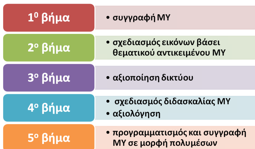
Σχήμα 2: βήματα δημιουργίας μαθησιακού υλικού αμερικανικού στυλ

Αυτά τα 5 στάδια διαμόρφωσης ακολουθούνται από τις ομάδες ανάπτυξης μαθησιακού υλικού που περιλαμβάνουν: