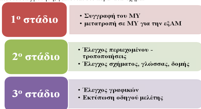
Σχήμα 1: Στάδια διαμόρφωσης έντυπου μαθησιακού υλικού για την εξ αποστάσεως μάθηση

Ιδίως, για την έντυπη μορφή του μαθησιακού υλικού, δηλαδή το εγχειρίδιο μελέτης που αποτελεί τον πυρήνα της ύλης και βασίζεται στο μαθησιακό υλικό της συμβατικής εκπαίδευσης, παρατηρούνται ορισμένα βασικά στάδια διαμόρφωσής του, η συγγραφή της ύλης/περιεχομένου, η μετατροπή σε μαθησιακό υλικό ειδικά διαμορφωμένο για την εξ αποστάσεως μάθηση, ο έλεγχος περιεχομένου, ο έλεγχος δομής, γλώσσας, σύνταξης, ο έλεγχος γραφικών και η εκτύπωση του οδηγού μελέτης. Αυτά τα στάδια δημιουργίας της έντυπης μορφής μαθησιακού υλικού για την εξ αποστάσεως μάθηση, φαίνονται στο παρακάτω σχήμα: