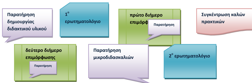
Σχήμα 1: Στάδια μελέτης επιμορφωτικής διαδικασίας των καθηγητών-συμβούλων

Η επιμορφωτική διαδικασία ξεκίνησε με τον σχεδιασμό και την ανάπτυξη του διδακτικού υλικού της επιμόρφωσης σε όλο το εύρος των ΣΕΠ σε θέματα εξΑΕ, εκπαίδευσης ενηλίκων και τεχνολογίας. Ο σχεδιασμός των φάσεων της επιμόρφωσης προέβλεπε τρία επιμορφωτικά διήμερα, τα δύο πρώτα εκ των οποίων αφορούσαν θέματα εξΑΕ, εκπ/σης ενηλίκων και το τρίτο θέματα τεχνολογίας. Η ερευνήτρια συμμετείχε στις συναντήσεις σχεδιασμού και ανάπτυξης του εκπαιδευτικού υλικού της επιμόρφωσης, στα δύο πρώτα επιμορφωτικά διήμερα και στην παρουσίαση των μικροδιδασκαλιών από τους επιμορφούμενους. Κατά τη διάρκειά τους, κατέγραψε με άμεση παρατήρηση και συμμετοχή στην ομάδα, άτυπες συνεντεύξεις, συλλογικές συζητήσεις, αναλύσεις των δράσεων που παράχθηκαν μέσα στην ομάδα. Στο πρώτο επιμορφωτικό διήμερο οι επιμορφούμενοι συμπλήρωσαν ερωτηματολόγιο με ερωτήσεις ανοικτού και κλειστού τύπου. Οι στόχοι της έρευνας είναι: