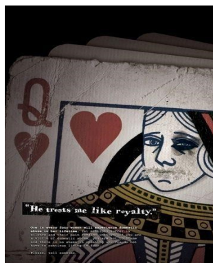
Εικόνα 2: "Εμφυλη βία"(χ.χ.)

Τα έργα αυτά θα μπορούσαν να αποτελέσουν εναύσματα τόσο για κωδικοποιήσεις- αποκωδικοποιήσεις, για εξαγωγή των κατά Freire «παραγωγικών» λέξεων, όσο και για επεξεργασία των επιμέρους θεμάτων και σταδιακή κατάκτηση του τελικού επιπέδου της «κριτικής συνειδητοποίησης» (Freire, 1977), με στόχο την αλλαγή.