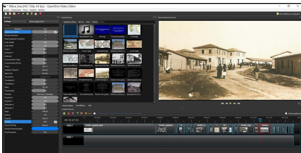
Εικόνα 2: το ντοκιμαντέρ δημιουργήθηκε με το λογισμικό OpenShot Video Editor.

Ένας μαθητής της ομάδας ανέλαβε την τεχνική επεξεργασία του ντοκιμαντέρ, δηλαδή την προσαρμογή πλάνων και εικόνων στην αφήγηση του σεναρίου. Χρησιμοποίησε το λογισμικό επεξεργασίας βίντεο OpenShot Video Editor, που είναι ελεύθερο και ανοιχτού κώδικα. Λόγω της εξοικείωσής του με την τεχνολογία, δεν δυσκολεύτηκε στη χρήση του, παρότι το χρησιμοποίησε πρώτη φορά (εικόνα 2).