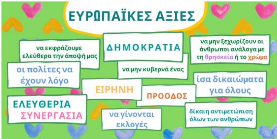
Εικόνα 3: Καταγισμός ιδεών από τους μαθητές του ΣΤ1 Η εικόνα έχει δημιουργηθεί στο https://www.canva.com/

Μία μαθήτρια έφτιαξε μια παρουσίαση με θέμα τη δημοκρατία και άλλοι μαθητές ζωγράρισαν για τη δημοκρατία με τον δικό τους τρόπο. Ακολούθησε συζήτηση για τις δημοκρατικές αξίες, τα παιδιά τις απεικόνισαν με τον δικό τους τρόπο, τις παρουσίασαν και έφεραν στην εικονική τάξη αποφθέγματα από γνωστούς Έλληνες σχετικά με τη δημοκρατία (Εικόνα 4).