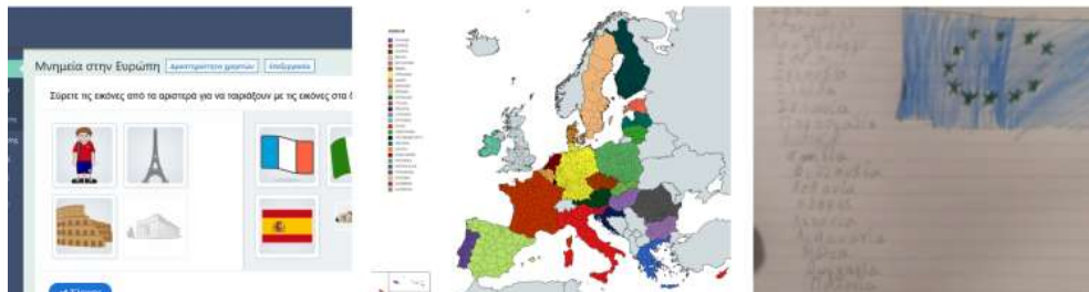
Εικόνα 1: Δραστηριότητες που υλοποιήθηκαν από το Ε1 εξ αποστάσεως

Η σύνθεση της εικόνας έχει γίνει στο https://www.canva.com/