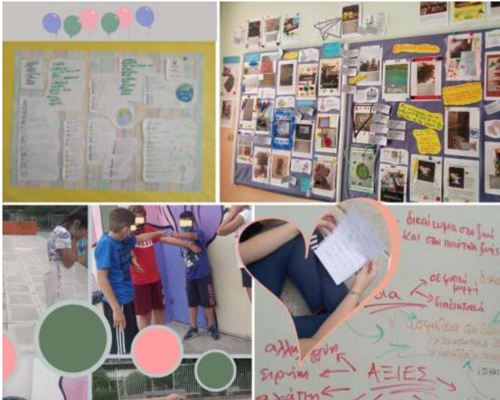
Εικόνα 2: Δραστηριότητες που υλοποιήθηκαν από το Ε1 δια ζώσης Η σύνθεση της εικόνας έχει γίνει στο https://www.canva.com/

Τέλος, δημιουργήθηκε ταμπλό με εργασίες σε κεντρικό χώρο του σχολείου, αξιοποιήθηκαν η ιστοσελίδα του σχολείου και σελίδες του έργου και του σχολείου στα μέσα κοινωνικής δικτύωσης στο πλαίσιο διάχυσης πρακτικών του προγράμματος (Εικόνα 2).