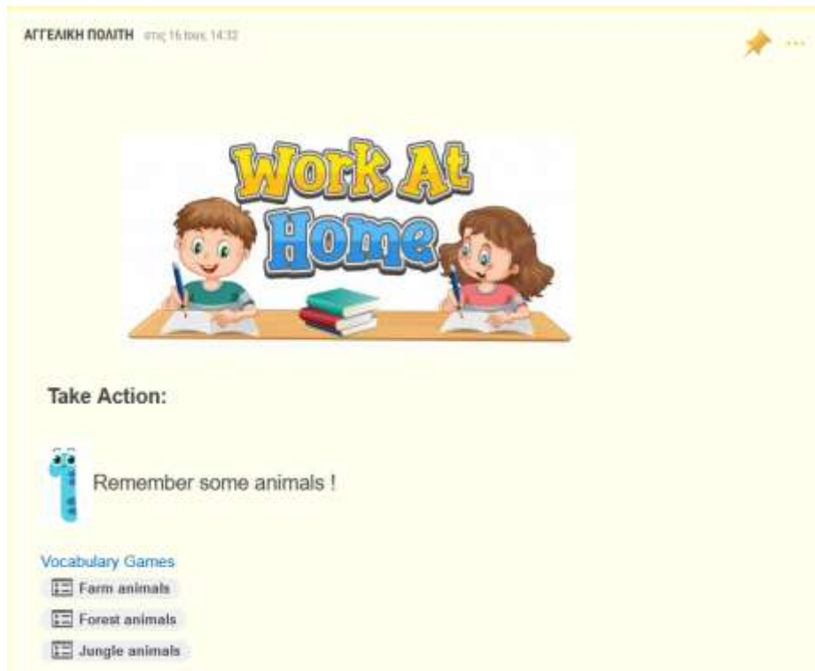
Εικόνα 2. Α΄ ΦΑΣΗ (2η ανάρτηση, τοίχος κυψέλης)

Β΄ Φάση (30΄): Σύγχρονη (WebEx) ανάρτηση 2 Τοίχος κυψέλης (Βήμα 5) εργασίες για εξάσκηση και εμπέδωση της νέας γνώσης, ανατροφοδότηση, χωρισμός σε ομάδες εργασίας, ανάθεση εργασίας ανά ομάδα, ανάθεση ρόλων, καθοδήγηση ομάδων, δημιουργία μαθητικής κυψέλης (Εικόνα 3).