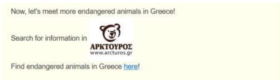
Εικόνα 3. Β΄ ΦΑΣΗ (3η ανάρτηση, τοίχος κυψέλης)

Β΄ Φάση (30΄): Σύγχρονη (WebEx) ανάρτηση 2 Τοίχος κυψέλης (Βήμα 5) εργασίες για εξάσκηση και εμπέδωση της νέας γνώσης, ανατροφοδότηση, χωρισμός σε ομάδες εργασίας, ανάθεση εργασίας ανά ομάδα, ανάθεση ρόλων, καθοδήγηση ομάδων, δημιουργία μαθητικής κυψέλης (Εικόνα 3).