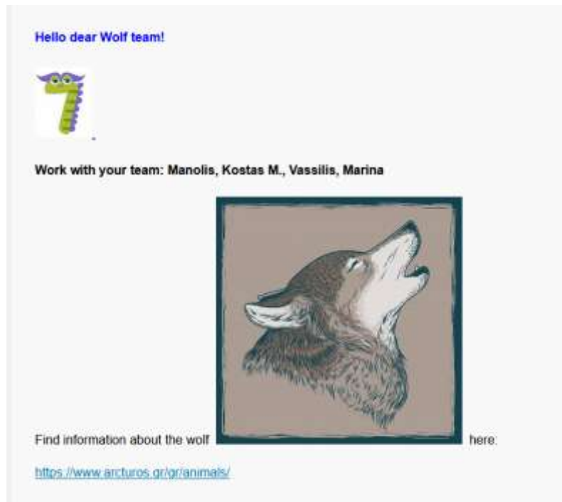
Εικόνα 4. Γ΄ ΦΑΣΗ (4η ανάρτηση, τοίχος κυψέλης)

Δ΄ Φάση: Σύγχρονη (WebEx, 30΄)- Ασύγχρονη (e-me, 20΄)- 5η ανάρτηση Τοίχου κυψέλης (Βήματα 7-10) παρουσίαση σε ολομέλεια, διάλογος, επίλυση, αυτό-αξιολόγηση, αποτίμηση της μαθησιακής διαδικασίας, δημοσιοποίηση υλικού και ανάδειξη ατομικού έργου (Εικόνα 5)