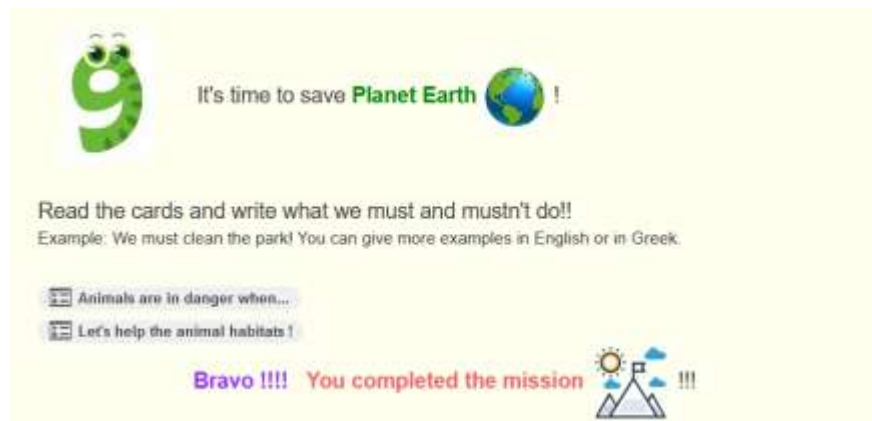
Εικόνα 5. Δ΄ ΦΑΣΗ (5η ανάρτηση, τοίχος κυψέλης)

Δ΄ Φάση: Σύγχρονη (WebEx, 30΄)- Ασύγχρονη (e-me, 20΄)- 5η ανάρτηση Τοίχου κυψέλης (Βήματα 7-10) παρουσίαση σε ολομέλεια, διάλογος, επίλυση, αυτό-αξιολόγηση, αποτίμηση της μαθησιακής διαδικασίας, δημοσιοποίηση υλικού και ανάδειξη ατομικού έργου (Εικόνα 5)