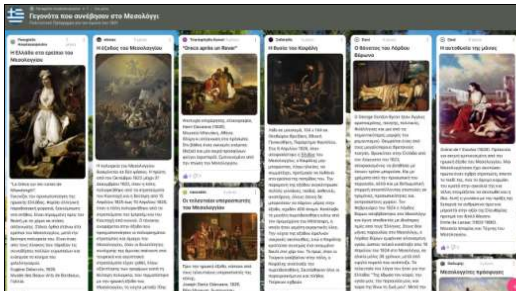
Εικόνα 3: τμήμα του ψηφιακού πίνακα στο Padlet, με γεγονότα που συνέβησαν στο Μεσολόγγι