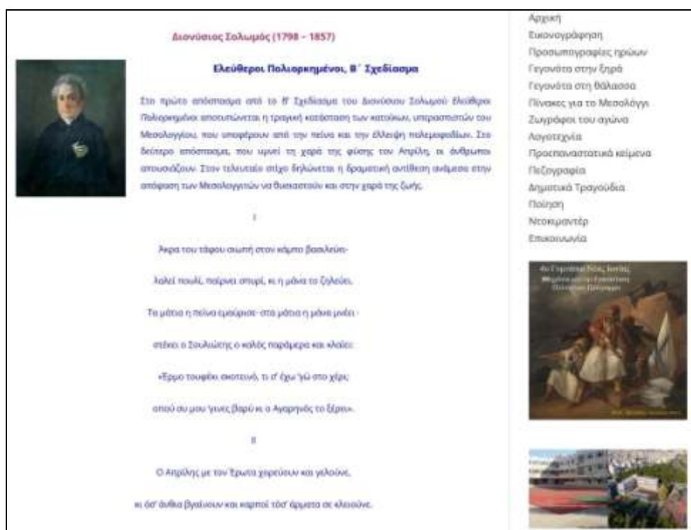
Εικόνα 4: Τμήμα της ιστοσελίδας του σχολείου για την ποίηση στα χρόνια της Επανάστασης

Δημιουργήσαμε τέσσερα κοινόχρηστα έγγραφα και σε καθένα από αυτά δόθηκε δικαίωμα επεξεργασίας στις μαθήτριες και στους μαθητές που ανέλαβαν να συγκεντρώσουν το αντίστοιχο υλικό κάθε εγγράφου. Τα κοινόχρηστα αρχεία Google Docs στα οποία οι συμμετέχοντες/ουσες αναρτούσαν τις επιλογές τους, με μία εικόνα του λογοτέχνη, αν υπήρχε, αναφέρονταν στις παρακάτω θεματικές ενότητες: α) Προεπαναστατικά κείμενα και τραγούδια, β) Πεζογραφία στα χρόνια της επανάστασης, γ) Δημοτικά τραγούδια, δ) Ποίηση στα χρόνια της επανάστασης. Στη συνέχεια το υλικό δημοσιεύτηκε στον ιστότοπο του σχολείου (εικ. 4).