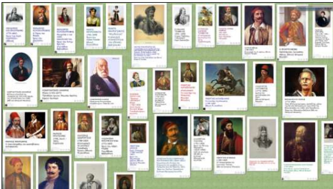
Εικόνα 2: ο ψηφιακός πίνακας με τις προσωπογραφίες των ηρώων στο Lino

Για τους επόμενους ψηφιακούς πίνακες-τοίχους που επρόκειτο να δημιουργήσουμε ζητήσαμε από τις μαθήτριες και τους μαθητές, που συμμετείχαν στο πρόγραμμα, να επιλέξουν ποιον από τους δύο ιστοτόπους προτιμούν (Padlet ή Lino). Δημιουργήσαμε ένα ανώνυμο ερωτηματολόγιο στο περιβάλλον της η-τάξης (eclass.sch.gr), στο οποίο απάντησαν οι περισσότεροι μαθητές/τριες του προγράμματος. Το αποτέλεσμα του ερωτηματολογίου ήταν 70% υπέρ του Padlet, έναντι 30% υπέρ του Lino. Έτσι, οι υπόλοιποι τρεις ψηφιακοί πίνακες-τοίχοι δημιουργήθηκαν στον ιστότοπο Padlet.