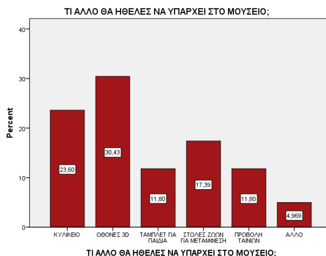
Διάγραμμα 3. Προτάσεις για το χώρο του Μουσείου

Καταλήγοντας, το 80,12% των μαθητών/τριών, μας δήλωσαν πως θα ήθελαν να ξαναζήσουν την εμπειρία του μουσείου, ενώ το 18,01 ίσως, ενώ μόλις το 1,86 απάντησαν αρνητικά. Οπότε συμπεραίνουμε πως ικανοποιήθηκαν οι προσδοκίες τους από τη συμμετοχή στα εκπαιδευτικά προγράμματα.