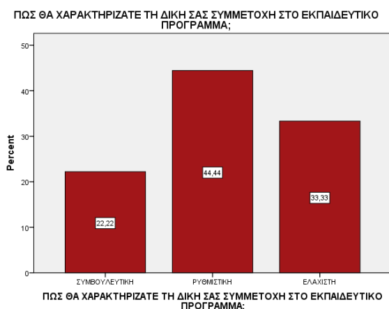
Διάγραμμα 4. Η συμμετοχή των εκπαιδευτικών στο Μουσείο

Οι εκπαιδευτικοί έκριναν επίσης τη συμμετοχή τους στο πρόγραμμα κυρίως ως ρυθμιστική, έπειτα ως ελάχιστη και τέλος ως συμβουλευτική (Διάγραμμα 4).