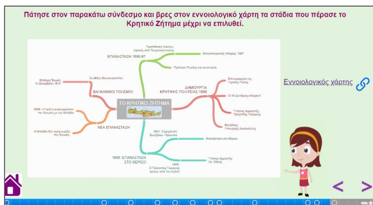
Εικόνα 4.2: Παράδειγμα εννοιολογικού χάρτη στο κεφ. «Το Κρητικό Ζήτημα»