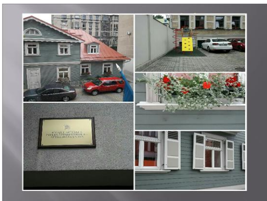
Εικόνα 4: Ειδικό σχολείο στη Λετονία