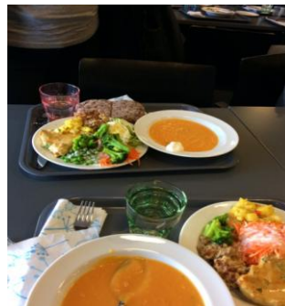
Εικόνα 3: Παρέχεται ποιοτικό φαγητό σε όλους τους μαθητές

Όσον αφορά τη Λετονία διαπιστώσαμε ότι δεν έχει μεγάλες διαφορές στη γενική εκπαίδευση από το ελληνικό σχολείο. Οι μαθητές αρχίζουν το σχολείο όταν συμπληρώσουν το 7 ο έτος της ηλικίας τους. Τα σχολεία λειτουργούν μέχρι τις 2:00μ.μ. και παρέχονται και κάποιες παροχές εντός σχολείου όπως κολύμβηση. Το διαφορετικό είναι η πρόιμη ανίχνευση μαθησιακών δυσκολιών και ειδικών εκπαιδευτικών αναγκών από την ηλικία του νηπιαγωγείου. Αν διαπιστωθεί από την αξιολόγηση ότι ο μαθητής χρειάζεται εξειδικευμένη στήριξη, το κράτος φροντίζει να παρέχει ειδικό δάσκαλο στη γενική τάξη, αξίζει να σημειωθεί έναν για κάθε παιδί, ή να προτείνει την ένταξή του σε ένα ειδικό σχολείο. Την τελική απόφαση βέβαια, όπως και στο ελληνικό εκπαιδευτικό σύστημα, την παίρνουν οι γονείς. Αξίζει επίσης να σημειωθεί ότι δεν υπάρχει τμήμα ένταξης, αλλά υπάρχει μια ειδικότητα που ονομάζεται δάσκαλος κοινωνικής αγωγής ( social teacher) σε κάθε σχολείο και ασχολείται αποκλειστικά με την κοινωνική ένταξη των παιδιών με ειδικές εκπαιδευτικές ανάγκες από τη μια μεριά και από την άλλη με τη στήριξη της οικογένειας.