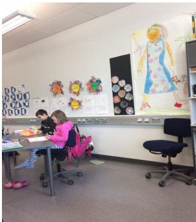
Εικόνα 1: Οι αίθουσες είναι άρτια εξοπλισμένες

• Κάθε αίθουσα είναι τεχνολογικά άρτια εξοπλισμένη. Σε κάθε αίθουσα υπάρχουν αναμονές για σύνδεση με το διαδίκτυο, στερεοφωνικά συστήματα και κάθε είδους εξοπλισμός άμεσα διαθέσιμος για όλους τους εκπαιδευτικούς και μαθητές