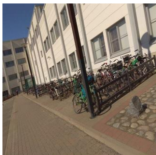
Εικόνα 2: Οι μαθητές πηγαίνουν με ποδήλατα στο σχολείο στα σχολεία της Φιλανδίας