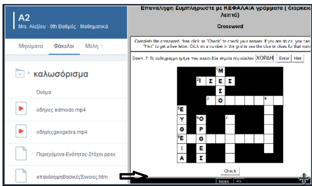
Εικόνα 1. Το υλικό του φακέλου "καλωσόρισμα" και το τεστ αυτοαξιολόγησης

Ξεκινώντας το διαδικτυακό μάθημα οι μαθητές έρχονται σε επαφή με τον πρώτο φάκελο που φέρει το όνομα «καλωσόρισμα». Σε αυτόν υπάρχουν δύο βίντεο, η παρουσίαση με τίτλο «Περιεχόμενα-Ενότητας-Στόχοι.pptx» και ένα τεστ αυτοαξιολόγησης (εικόνα1). Τα βίντεο περιέχουν οδηγίες για το περιβάλλον του Edmodo και του Geogebra. Η παρουσίαση που δημιουργήθηκε με το PowerPoint γνωστοποιεί στους μαθητές από την αρχή του διαδικτυακού μαθήματος, με σαφήνεια το περιεχόμενο της διδασκαλίας, τους στόχους του μαθήματος και τις υποχρεώσεις τους, ώστε να είναι συνεπείς με τις δραστηριότητες, τα τεστ και το υλικό που πρέπει να μελετήσουν σε συγκεκριμένα χρονικά διαστήματα τα οποία είναι αναρτημένα στο χρονοδιάγραμμα της πλατφόρμας του Edmodo. Το τεστ αυτοαξιολόγησης που δημιουργήθηκε με το λογισμικό HotPotatoes περιέχει βασικές έννοιες που έχουν ήδη διδαχθεί. Με ευχάριστο τρόπο θα θυμηθούν τις πρωταρχικές γεωμετρικές έννοιες και ταυτόχρονα θα εισαχθούν ομαλά στη νέα ύλη που περιλαμβάνει την έννοια της μεσοκαθέτου.