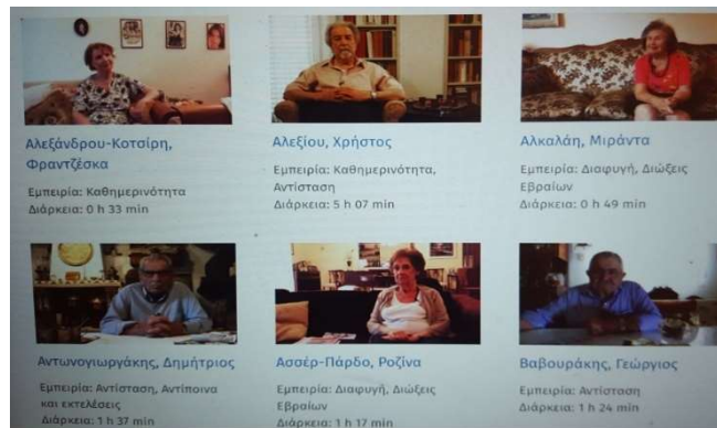
Εικόνα 2: Μάρτυρες αρχείου MOG.