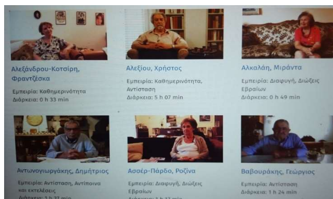
Εικόνα 2: Μάρτυρες αρχείου MOG.