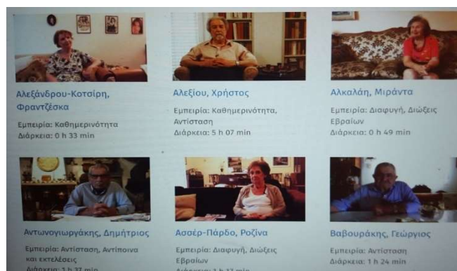
Εικόνα 2: Μάρτυρες αρχείου MOG.