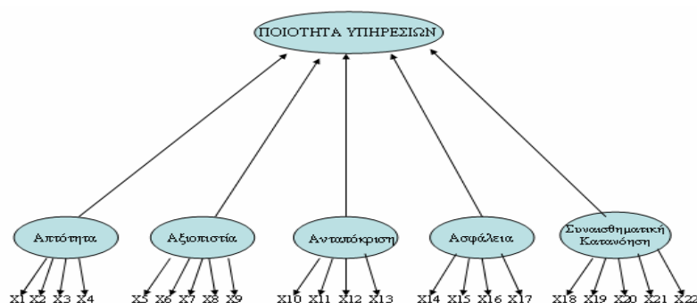
Σχήμα 1. Η ποιότητα υπηρεσιών κατά τη θεώρηση των Parasuraman, Berry, and Zeithaml (1988) και κατά την εξέταση της από τους Cronin και Taylor (1992)

Αν εφαρμόσουμε λοιπόν το μοντέλο του Kano (Kano, Seraku, Takahashi & Tsuji, 1984) στην εκπαιδευτική διαδικασία, θα διαπιστώσουμε, ότι δεν αρκεί να υπάρχει μόνο μία αίθουσα και να γίνεται μία απλή διδασκαλία. Πρέπει να προσφέρουμε στον μαθητή μια συναρπαστική εμπειρία, η οποία θα προκύψει από τη συμμετοχή του στη διαδικασία διδασκαλίας – μάθησης, από τη δυνατότητα που θα του δοθεί να αυτενεργεί, να πειραματίζεται, να ανακαλύπτει. Έτσι ο μαθητής θα είναι ευχαριστημένος και αυτό θα έχει ως αποτέλεσμα να ενδιαφέρεται για το μάθημα, να προσέχει περισσότερο και άρα να μαθαίνει (Ζαβλανός, 2003). Εντούτοις, ως αποτέλεσμα της ποσοτικής έρευνας και ανάλυσης εντοπίστηκαν πέντε καθορισμένες διαστάσεις της ποιότητας υπηρεσιών, οι οποίες εμφανίζονται και στο Σχήμα 7 (Parasuraman et al., 1988) :