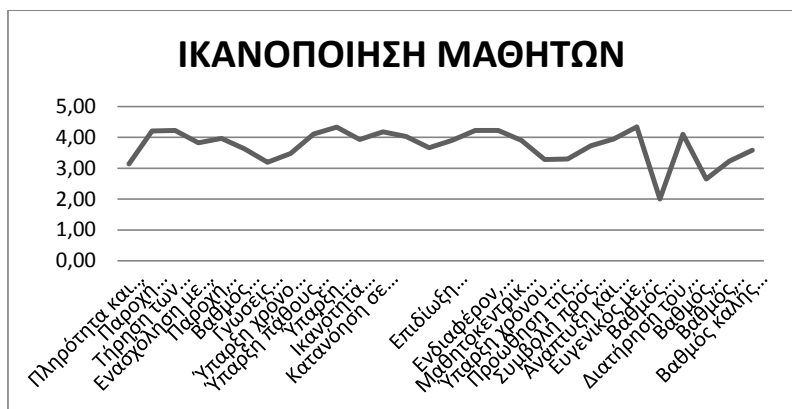
Σχήμα 2. Οι μέσοι όροι των μεταβλητών για τον τομέα της ικανοποίησης των μαθητών

Στο Σχήμα 2 αποτυπώνονται οι Μ.Ο. των μεταβλητών για την ικανοποίηση των μαθητών. Παρατηρούμε, ότι η πλειοψηφία των τιμών των Μ.Ο. είναι μεταξύ 3-4, αλλά υπάρχουν και αρκετές διακυμάνσεις, δηλαδή αρκετές τιμές που είναι μεγαλύτερες του 4 και μικρότερες του 3, άρα δεν υπάρχει σταθερότητα στις τιμές των Μ.Ο.