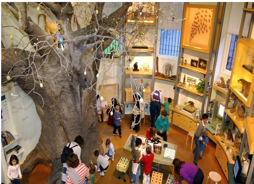
Σχήμα 4: Αίθουσα Ανακαλύψεων στο Αμερικανικό Μουσείο Φυσικής Ιστορίας

Γενικά, οι αίθουσες αυτές, κατά τον Danilov (1986), στοχεύουν στην κατανόηση και τη γνώση των επισκεπτών μέσα από ενδιαφέρουσες, παιγνιώδεις διαδραστικές, ψηφιακές τεχνικές αφής.