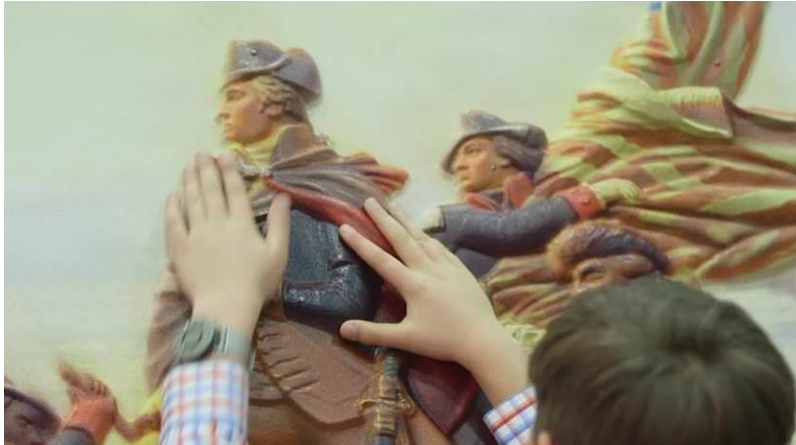
Σχήμα 5: Απτικά αντίγραφα για ψηλάφηση