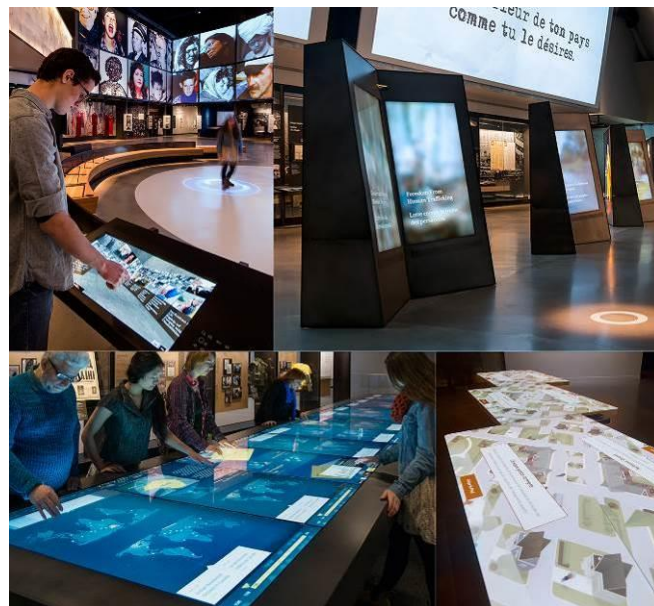
Σχήμα 2: Κιόσκια Πληροφόρησης σε Μουσεία