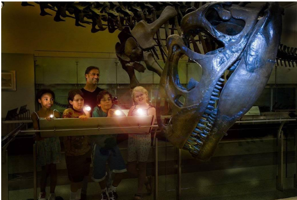
Σχήμα 3: Διαδραστικό παιχνίδι στο Αμερικανικό Μουσείο Φυσικής Ιστορίας

κατακόρυφα τη διαδραστικότητα και την αφοσίωση των χρηστών. Αναφορικά με τα μουσεία αφορά στη χρήση/ενσωμάτωση διαφόρων μηχανισμών/χαρακτηριστικών παιχνιδιού σε καταστάσεις/δραστηριότητες που δεν σχετίζονται με το παιχνίδι, με στόχο τη λύση προβλημάτων μέσω της αύξησης της διαδραστικότητας και της συμμετοχικότητας των χρηστών). Όσον αφορά το edutainment, πρόκειται για συμφυρμό –blending-, ο οποίος σχηματίζεται από το συνδυασμό των λέξεων education και entertainment, ήτοι εκπαίδευση και ψυχαγωγία, (βλ. Σχήμα 3). Αυτενεργώ λοιπόν και μαθαίνω σε ένα Μουσείο-φόρουμ μέσω της παιχνιδοποίησης, χωρίς να αισθάνομαι πια τη μουσειακή κόπωση, (που επέρχεται γρήγορα στον επισκέπτη, που ακολουθεί τη μονότονη, μονοδιάστατη και απρόσωπη, προκαθορισμένη, τυπική ξενάγηση σε ένα παραδοσιακού τύπου μουσείο). Τα παιχνίδια εισάγουν νέες μορφές σκέψης και συμπεριφοράς και εξοικειώνουν ευκολότερα και πιο ευχάριστα το κοινό με τα μουσειακά εκθέματα. Οι δυνατότητες τους να μετασχηματίσουν τη τυπική διδασκαλία και μονοδιάστατη μάθηση σε μια ψυχαγωγική διαδικασία είναι πολλές και τα μουσεία που το έχουν αντιληφθεί και εντάζει στον εκπαιδευτικό τους σχεδιασμό τέτοιου είδους επιλογές, βλέπουν το νεανικό κοινό τους να αυξάνεται.