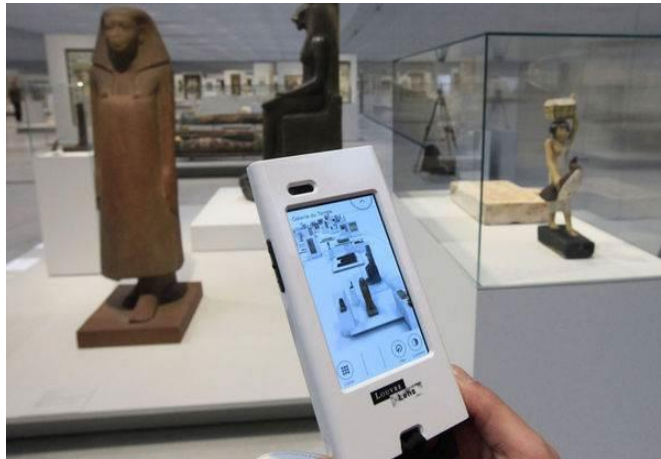
Σχήμα 1: Πολυμεσικός οδηγός- ξεναγός χειρός στο Μουσείο του Λούβρου

επιθυμούν να αναβαθμίσουν της υπηρεσίες τους και τις δυνατότητες που παρέχουν στον επισκέπτη για εξερεύνηση στις συλλογές τους. (NMC Horizon Report: Museum Edition, 2015). Με τέτοιου είδους λογισμικά, τα σύγχρονα μουσεία στοχεύουν κυρίως στην προσέλκυση και εμπλοκή του νεανικού κοινού στα μουσειακά δράματα, προσφέροντας του τόσο ομαδικές, όσο και εξατομικευμένες περιηγήσεις.