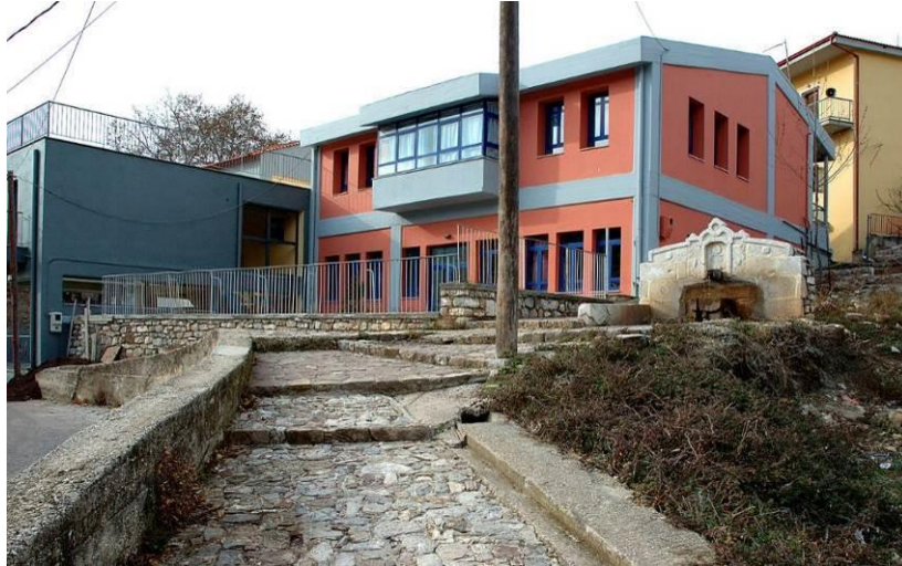
Εικόνα 5: Το Νηπιαγωγείο της Ανάβρας