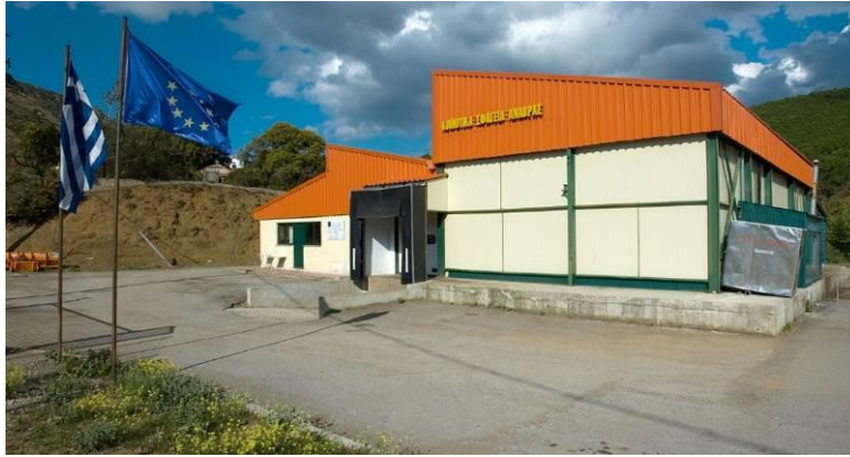
Εικόνα 3: Το συσκευαστήριο κρέατος της Ανάβρας