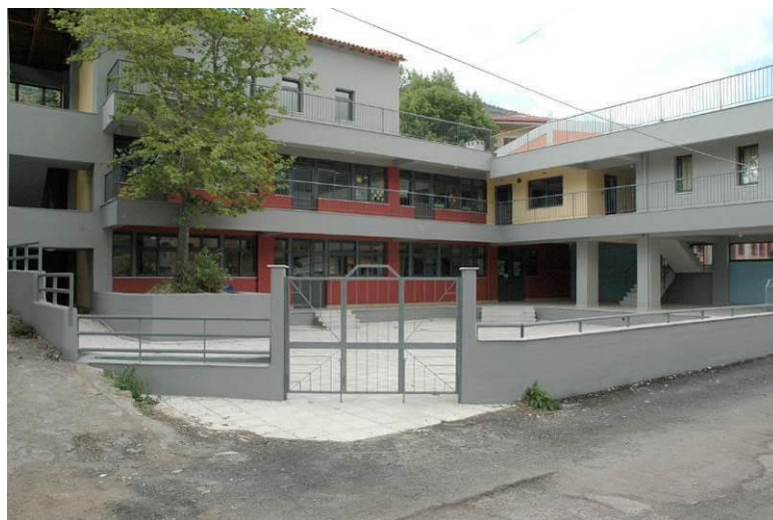
Εικόνα 4: Το Δημοτικό Σχολείο Ανάβρας