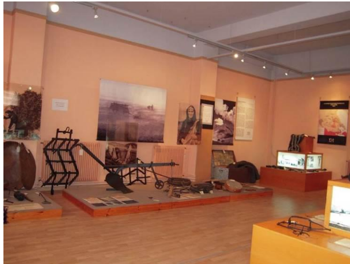
Εικόνα 8: Το Λαογραφικό Μουσείο Κτηνοτροφικής Ζωής

Από τα σημαντικότερα έργα είναι η κατασκευή ΧΥΤΑ από την κοινότητα της Ανάβρας το 1994, αλλά και το αιολικό πάρκο Αλογοράχης, παραγωγής ηλεκτρικής ενέργειας, το 2006. Το πάρκο βρίσκεται σε υψόμετρο 1650 μέτρα, είναι το ψηλότερο της χώρας, έχει είκοσι ανεμογεννήτριες συνολικής ισχύος 17 MW, με ανάδοχο την ισπανική εταιρία Gamesa (Μπιλανάκη, 2011). Επίσης σχεδιάζόταν η κατασκευή ακόμη δύο αιολικών πάρκων. Εκτός από την περιβαλλοντική του αξία, το υφιστάμενο πάρκο, και τα δύο που είχαν προγραμματιστεί, συμβάλλουν στη γενικότερη ανάπτυξη της περιοχής, καθώς μέρος των εσόδων από την παραγωγή της ηλεκτρικής ενέργειας αποδίδονται στην τοπική κοινότητα (Δούρβος Α΄τηλ. συνέντευξη).