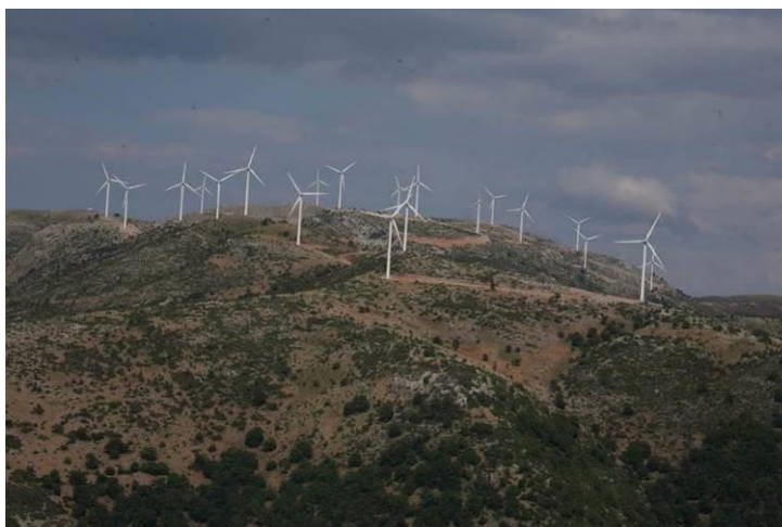
Εικόνα 9: Το αιολικό πάρκο Αλογοράχης