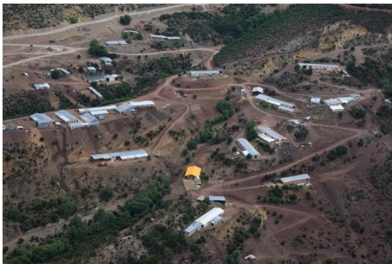
Εικόνα 2: Τα κτηνοτροφικά πάρκα