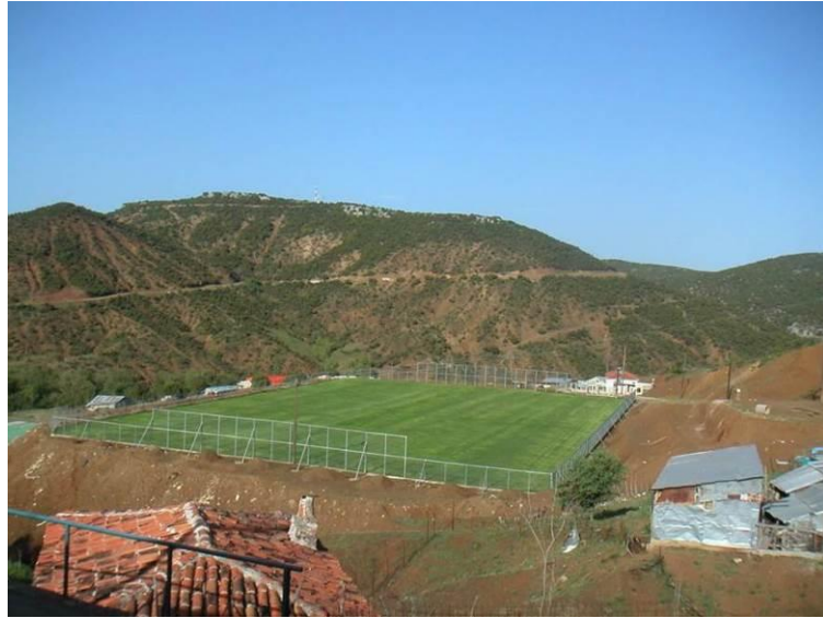
Εικόνα 7: Το γήπεδο ποδοσφαίρου της Ανάβρας