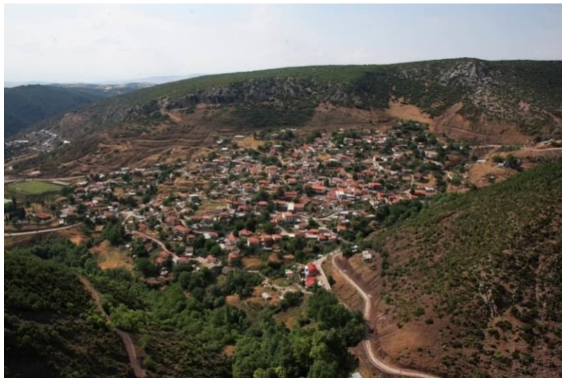
Εικόνα 1: Η Ανάβρα Μαγνησίας

Οι πηγές της Ανάβρας είναι συνυφασμένες με την ίδια την κοινότητα. Η σημαντικότητά τους αποδεικνύεται από το ότι έχουν δώσει το όνομά τους στο χωριό. Βρίσκονται σε υψόμετρο 770 περίπου μέτρων στην κεντρική Όθρυ και σε απόσταση 700 μέτρων ανατολικά- νοτιοανατολικά σε σχέση με τον οικισμό. Αποτελούν τις πηγές ενός από τους σπουδαιότερους παραπόταμους του Πηνειού, του Ενιπέα ποταμού. Τα παλιότερα χρόνια κατά μήκος του ποταμού λειτουργούσαν πολλές υδροκίνητες εγκαταστάσεις, όπως μαντάνια, ντριστέλες και υδρόμυλοι, οι οποίες ήταν ταυτισμένες με την οικονομική ζωή του τόπου. Εξίσου σημαντικό ρόλο είχε και στα κοινωνικά δρώμενα, καθώς εκεί πραγματοποιούνταν το πανηγύρι του Αγίου Παντελεήμονα, στις 27-28 Ιουλίου, ενώ είναι και το μέρος όπου τελείται ο αγιασμός των υδάτων στα Θεοφάνεια. ακόμη και σήμερα. Οι πηγές και ο ποταμός υπήρξαν λοιπόν διαχρονικά το κέντρο κατασκευαστικής και βιοτεχνικής δημιουργίας των κατοίκων. Σήμερα, αποτελεί σημείο αναφοράς τόσο για τους κατοίκους όσο και για τους επισκέπτες, αφού η φυσική ομορφιά και η περιβαλλοντική σημασία του χώρου, προσφέρονται για περίπατο και απόλαυση της δροσιάς κατά τους θερινούς μήνες (Ανάβρα- Ζω- πηγές).