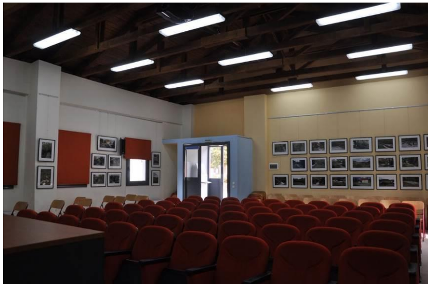
Εικόνα 6: Αίθουσα κοινωνικών εκδηλώσεων

Πέρα όμως από τις βασικές υποδομές η κοινότητα της Ανάβρας προχώρησε και στην κατασκευή έργων για τον αθλητισμό, τον πολιτισμό και την πράσινη ανάπτυξη. Στην Ανάβρα δημιουργήθηκαν και λειτουργούν, γήπεδο ποδοσφαίρου και μπάσκετ, σύγχρονο κλειστό γυμναστήριο (με δωρεάν πρόσβαση), τρεις βιβλιοθήκες με αίθουσα υπολογιστών και δωρεάν πρόσβαση στο διαδίκτυο (internet café) και δημιουργική απασχόληση των παιδιών, Λαογραφικό Μουσείο Κτηνοτροφικής Ζωής καθώς και τρεις αναρριχητικές πίστες (στη γύρω περιοχή) (Ανάβρα-Ζω – Η Ανάβρα, Δούρβος Α΄τηλ. συνέντευξη).