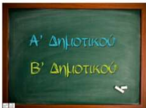
Εικόνα 2. Αρχική σελίδα ψηφιακού προσβάσιμου υλικού

Το ψηφιακό προσβάσιμο υλικό ακολουθεί μια συγκεκριμένη δομή. Με την ενεργοποίηση της ψηφιακής μορφής του βιβλίου ενός μαθήματος (π.χ. Γλώσσα) εμφανίζεται η αρχική σελίδα που παρέχει την επιλογή του εν λόγω σχολικού βιβλίου ανά τάξη.