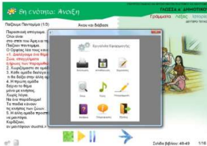
Εικόνα 6. Εργαλεία εφαρμογής

Επιλέγοντας το εικονίδιο της βοήθειας εμφανίζεται μία λίστα με βοηθητικά εργαλεία που υπάρχουν στην εφαρμογή και εξηγείται η χρήση τους, όπως η έναρξη ανάγνωσης, η παύση, η επανεκκίνηση από την αρχή, η μεταφορά στην επόμενη ή προηγούμενη σελίδα κ.α. (Εικόνα 7).