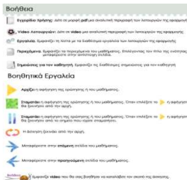
Εικόνα 7. Βοηθητικά εργαλεία

Επιλέγοντας το εικονίδιο της βοήθειας εμφανίζεται μία λίστα με βοηθητικά εργαλεία που υπάρχουν στην εφαρμογή και εξηγείται η χρήση τους, όπως η έναρξη ανάγνωσης, η παύση, η επανεκκίνηση από την αρχή, η μεταφορά στην επόμενη ή προηγούμενη σελίδα κ.α. (Εικόνα 7).