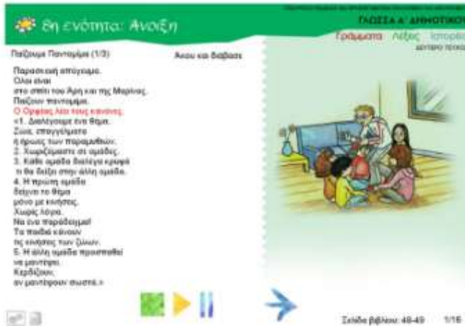
Εικόνα 4. Προσαρμοσμένο κείμενο