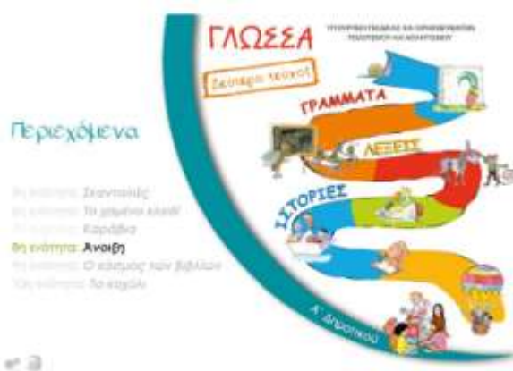
Εικόνα 3. Εισαγωγή στα περιεχόμενα του προσαρμοσμένου

Μόλις ο χρήστης επιλέξει την τάξη εμφανίζεται το σχολικό βιβλίο με τα περιεχόμενα για την επιλογή της ενότητας που τον ενδιαφέρει (Εικόνα 3). Επιλέγοντας τον τίτλο μιας ενότητας ο χρήστης μεταφέρεται στην αντίστοιχη σελίδα που εμφανίζεται το προσαρμοσμένο κείμενο. Το κείμενο ακολουθεί τη δομή και τις αρχές της μεθόδου easy to read. Παρέχεται η δυνατότητα να αναγινώσκεται από φυσικό ομιλητή και ταυτόχρονα κοκκινίζει το μέρος του κειμένου που ακούγεται (Εικόνα 4).