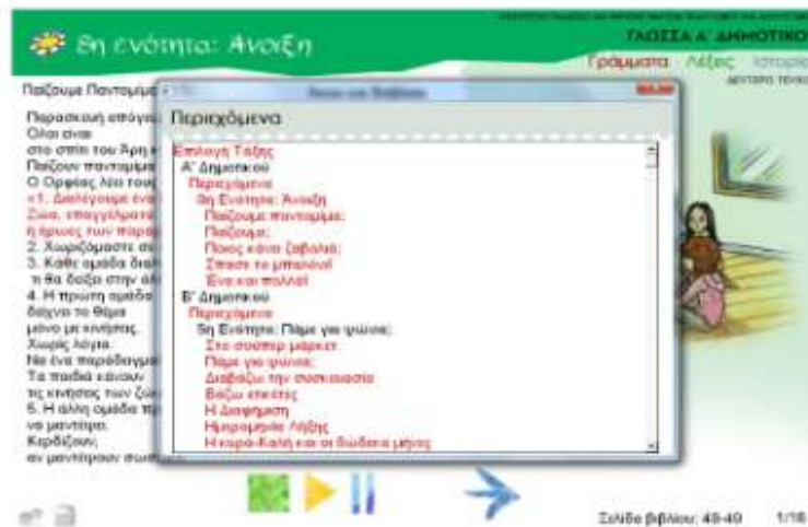
Εικόνα 5. Πλοήγηση στα περιεχόμενα.