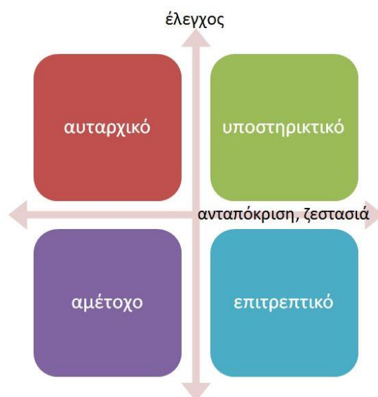
Γράφημα 1. Τα τέσσερα στυλ διαπαιδαγώγησης

Σύμφωνα με την ευρέως διαδεδομένη θεώρηση των Maccoby και Martin (1983), η έννοια ‘στυλ διαπαιδαγώγησης’ ορίζεται από τις δύο διαστάσεις που τη συγκροτούν: το βαθμό και τρόπο άσκησης ελέγχου και το βαθμό ανταπόκρισης με ζεστασιά, των γονέων προς τα παιδιά τους. Οι διαφοροποιήσεις που παρατηρούνται στους γονείς σε καθεμία από τις δύο διαστάσεις αυτές έχουν οδηγήσει στην καθιέρωση τεσσάρων στυλ διαπαιδαγώγησης, τα οποία είναι το υποστηρικτικό, το αυταρχικό, το επιτρεπτικό και το αμέτοχο (Γράφημα 1).