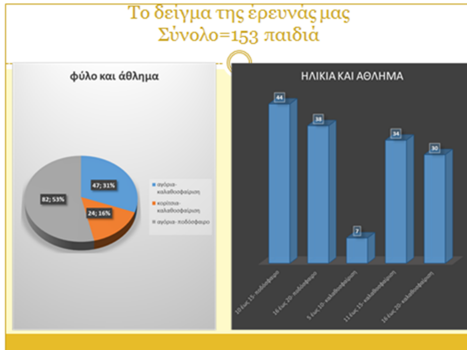
Γράφημα 1: Το δείγμα της έρευνάς μας-φύλο και άθλημα