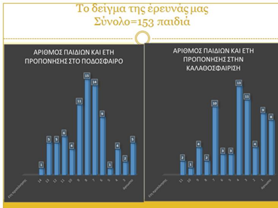
Γράφημα 3: Αριθμός παιδιών και έτη προπόνησης στο ποδόσφαιρο