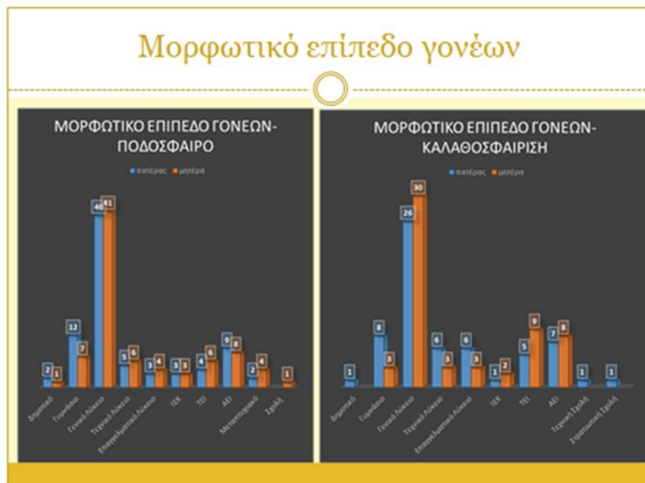
Γράφημα 5: Μορφωτικό επίπεδο γονέων-Ποδόσφαιρο

Οι γονείς των παιδιών που αθλούνται στο μπάσκετ έχουν τους εξής τίτλους: Γυμνασίου 8 πατέρες και 3 μητέρες, Γενικού Λυκείου 26 πατέρες και 30 μητέρες, Τεχνικού Λυκείου 6 πατέρες και 3 μητέρες, Επαγγελματικού Λυκείου 6 πατέρες και 3 μητέρες, Ι.Ε.Κ. 1 πατέρας και 2 μητέρες, Τ.Ε.Ι. 5 πατέρες και 9 μητέρες, Α.Ε.Ι. 7 πατέρες και 8 μητέρες, Τεχνικής Σχολής 1 πατέρας, 1 πατέρας έχει αποφοιτήσει από Στρατιωτική Σχολή και 1 έχει απολυτήριο Δημοτικού Σχολείου.