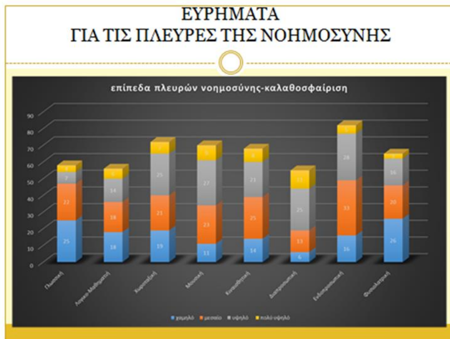
Γράφημα 8: Επίπεδα πλευρών νοημοσύνης- Καλαθοσφαίριση

Από τη συμπλήρωση του τεστ «Αποδοχή εαυτού και άλλων» φαίνεται ότι: Στο ποδόσφαιρο: 52 (65%) παιδιά αποδέχονται ισόρροπα τον εαυτόν τους και τους