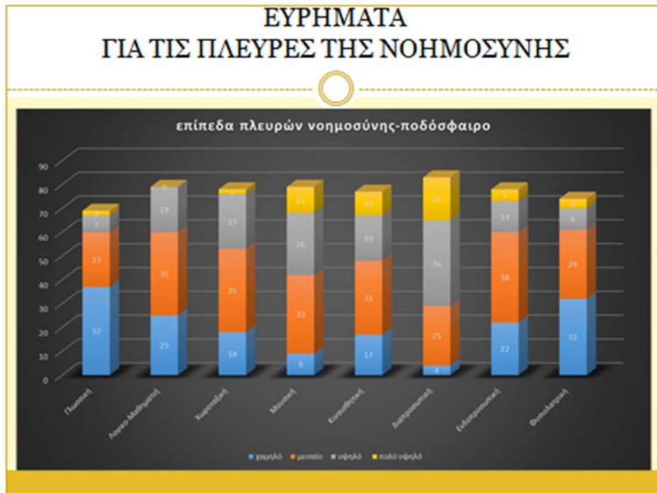
Γράφημα 7: Επίπεδα πλευρών νοημοσύνης-Ποδόσφαιρο Στο μπάσκετ: