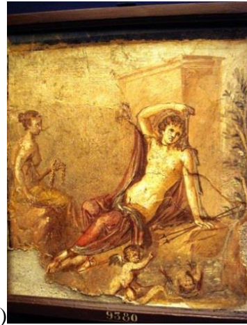
Νάρκισσος – Ηχώ Πομπηία (45-79 μ.Χ.)