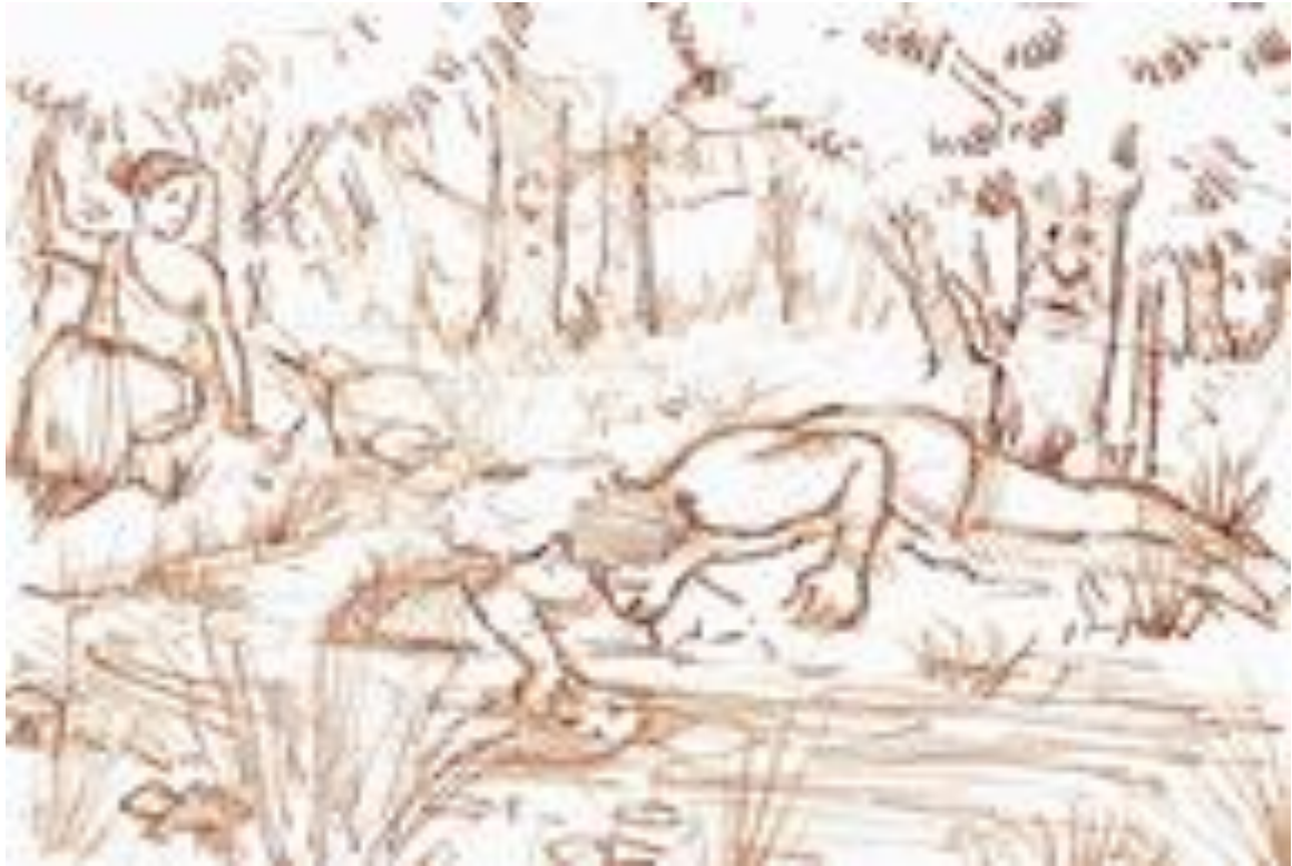
Νάρκισσος και Ηχώ. Σκίτσο Βασίλη Λιαούρη , 2017.