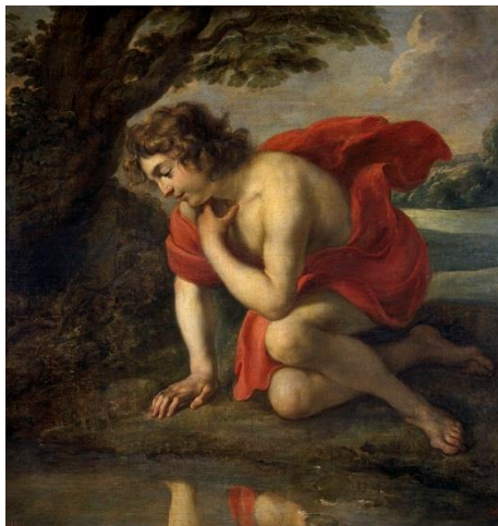
Jan Cossiers (1670-1671) Narciso