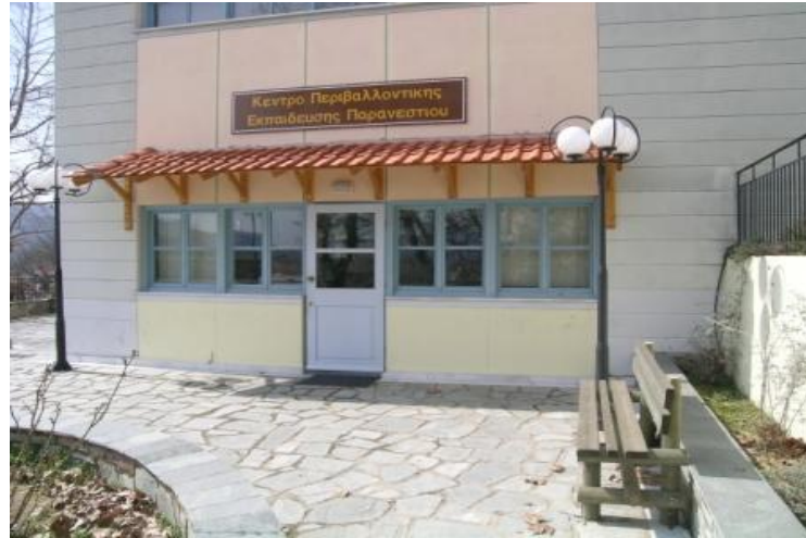
Εικόνα 3: Κ.Π.Ε. Παρανεστίου

Ένα ακόμη παράδειγμα πετυχημένου Κ.Π.Ε. στην Ελλάδα αποτελεί το Κέντρο Περιβαλλοντικής Εκπαίδευσης Σουφλίου, στο οποίο πραγματοποιούνται εκπαιδευτικά προγράμματα επισκέψεων των σχολείων σε αυτό. Εξειδικεύεται στην ενημέρωση και επιμόρφωση τόσο των εκπαιδευτικών όσο και των μαθητών στο σύνολο των ιδιοτήτων που αποτελούν τα διακριτικά γνωρίσματα του μεταξοσκώληκα. Στις δραστηριότητές του, εκτός των άλλων, συγκαταλέγονται η παρουσίαση εργασιών δημιουργικής έκφρασης των μαθητών σχετικές με τις βασικές λειτουργίες του μεταξοσκώληκα αλλά και η αναδοχή αυτών από τους μαθητές προκειμένου να συνεχίσουν την εκτροφή τους είτε στο σχολείο είτε στο σπίτι τους [7].