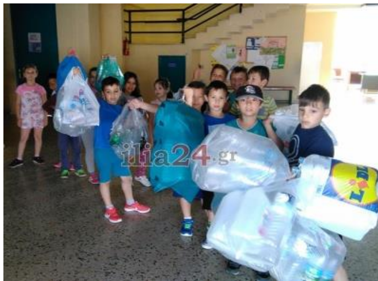
Εικόνα 6: Ανακύκλωση του 5ου Δημοτικού Σχολείου του Πύργου Ηλείας