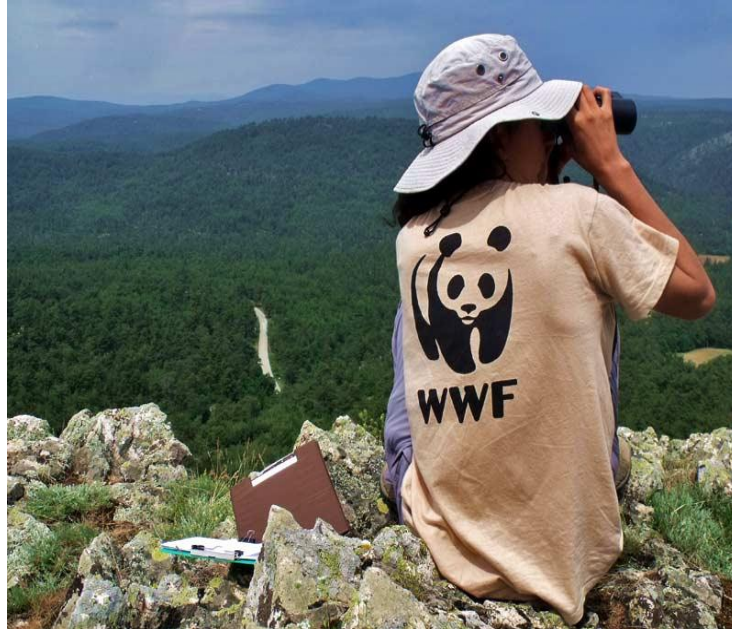
Εικόνα 1: Καταγράφοντας αρπακτικά στο δάσος της Δαδιάς

οικοσυστημάτων και των απειλούμενων ειδών. Τα τελευταία χρόνια ένας από τους στόχους της είναι να αντιμετωπίσει τις ανάγκες και τις απειλές που παρουσιάζει το δάσος της Δαδιάς – Λευκίμης – Σουφλίου [3].