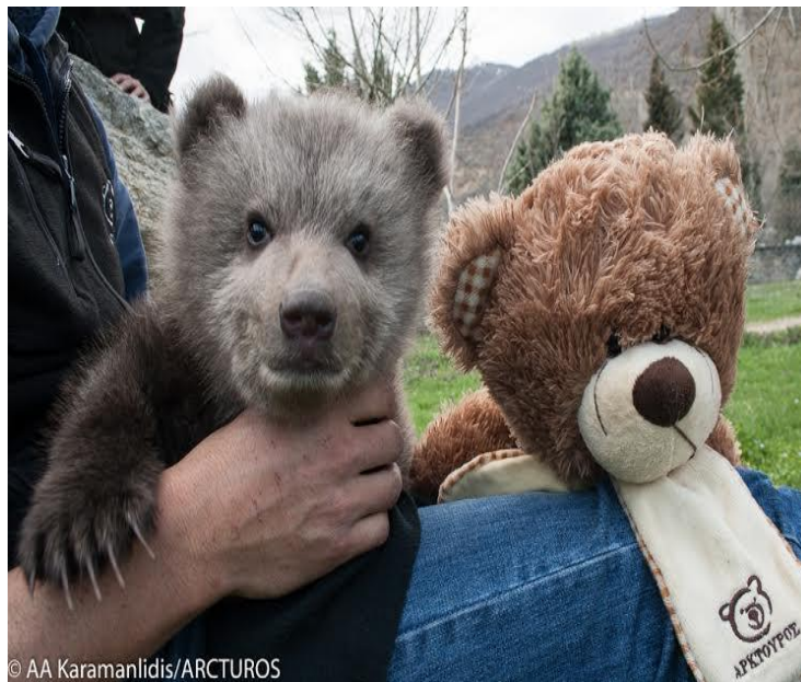
Εικόνα 2: Περίθαλψη αρκούδας από την επιστημονική ομάδα του Αρκτούρου

Β) Το πάρκο προστασίας της άγριας ζωής στο Νυμφαίο της Φλώρινας, ο Αρκτούρος, έχει ως στόχο την ενεργό δράση και συμμετοχή των πολιτών καθώς και του μαθητικού πληθυσμού στην προστασία των άγριων σαρκοφάγων και των βιοτόπων τους στα Βαλκάνια [4].