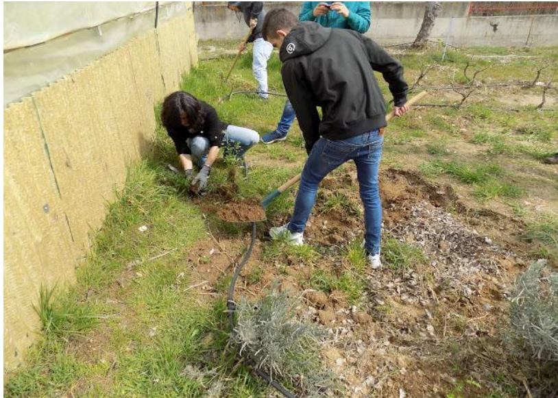
Εικόνα 7: Καλλιέργεια παραδοσιακών προϊόντων στο ΕΠΑ.Λ. Καστοριάς