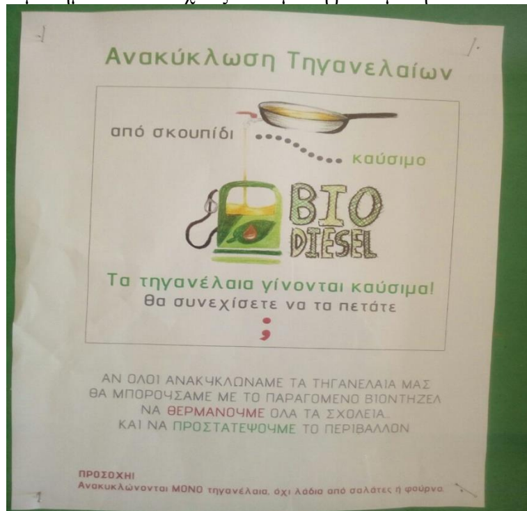
Εικόνα 5: Οι μαθητές στο 3ο Γενικό Λύκειο Αλεξανδρούπολης σε συνεργασία με τους καθηγητές και τον διευθυντή του σχολείου ανακυκλώνουν το τηγανέλαιο για να το χρησιμοποιήσουν ως βιοκαύσιμο το χειμώνα.

ότι σε όλα τα σχολεία πραγματοποιούνται περιβαλλοντικές δράσεις στο πλαίσιο των περιβαλλοντικών μαθημάτων που σχετίζονται με τη βιωσιμότητα.