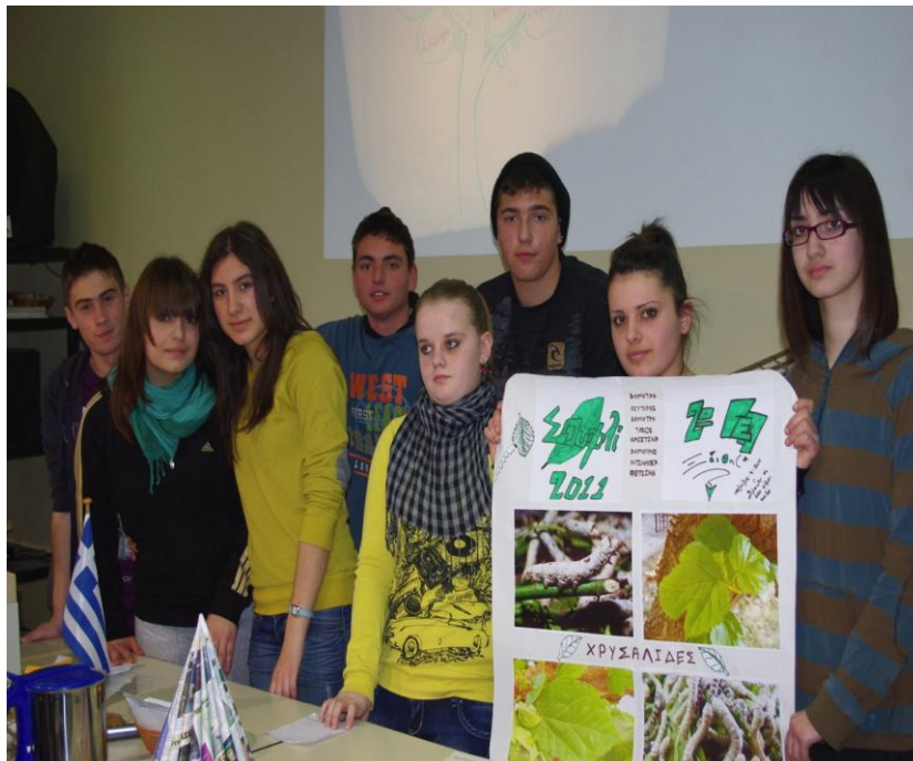
Εικόνα 4: Επίσκεψη του 2ου ΓΕΛ Ξάνθης στο Κ.Π.Ε. Σουφλίου

Ένα ακόμη παράδειγμα πετυχημένου Κ.Π.Ε. στην Ελλάδα αποτελεί το Κέντρο Περιβαλλοντικής Εκπαίδευσης Σουφλίου, στο οποίο πραγματοποιούνται εκπαιδευτικά προγράμματα επισκέψεων των σχολείων σε αυτό. Εξειδικεύεται στην ενημέρωση και επιμόρφωση τόσο των εκπαιδευτικών όσο και των μαθητών στο σύνολο των ιδιοτήτων που αποτελούν τα διακριτικά γνωρίσματα του μεταξοσκώληκα. Στις δραστηριότητές του, εκτός των άλλων, συγκαταλέγονται η παρουσίαση εργασιών δημιουργικής έκφρασης των μαθητών σχετικές με τις βασικές λειτουργίες του μεταξοσκώληκα αλλά και η αναδοχή αυτών από τους μαθητές προκειμένου να συνεχίσουν την εκτροφή τους είτε στο σχολείο είτε στο σπίτι τους [7].