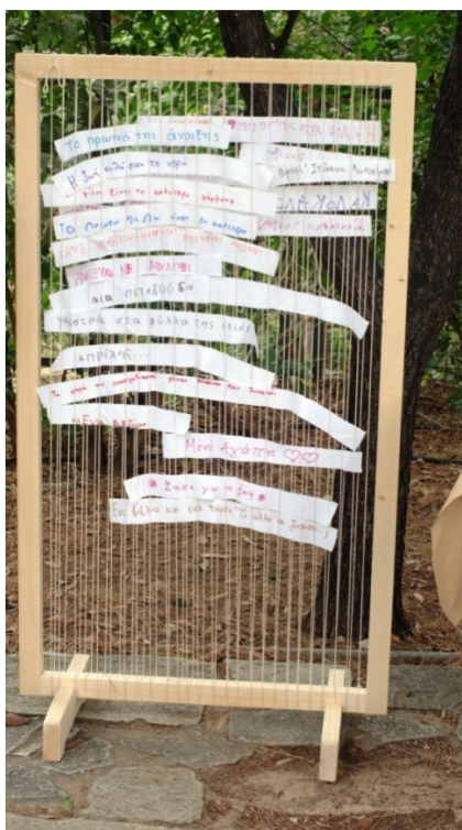
Εικόνα 5: Ο «αργαλειός της ποίησης», ανάγνωση ποιημάτων και επιλογή στίχων από τα παιδιά που τους έγραψαν και τους έπλεξαν στον αργαλειό: μια από τις δραστηριότητες της 2 ης γιορτής στον λόφο Φινόπουλου με θέμα «Διαβάζω στα πάρκα»

Το 51ο Δημοτικό Σχολείο Αθηνών, σχολείο με πολυπολιτισμικό χαρακτήρα βρίσκεται κοντά στην πλατεία Βάθης, περιοχή με ισχυρή συγκέντρωση μεταναστών και έντονη