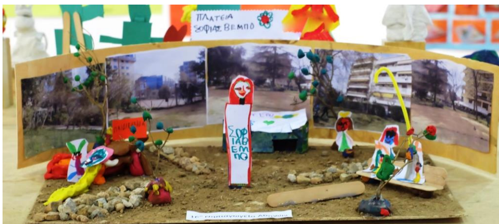
Εικόνα 2: Μακέτα των μαθητών του 16 ου Νηπιαγωγείου Αθηνών για τη διαμόρφωση της πλατείας της γειτονιάς τους. Κρατούν ως κεντρικό στοιχείο την υπάρχουσα προτομή και προσθέτουν στοιχεία που θα ήθελαν να έχει, χρησιμοποιώντας μεταξύ άλλων χόμα και πέτρες