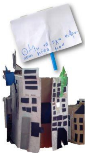
Εικόνα 6: Δίνοντας φωνή διαμαρτυρίας στα κτίρια, 57 ο Δ.Σ. Αθήνας

Με τα πέντε συνεχή χρόνια συμμετοχής στο δίκτυο, τα σχολεία αυτά απέκτησαν μια ισχυρή παράδοση στην ενεργό συμμετοχή στα κοινά της γειτονιάς (Εικόνα 6).