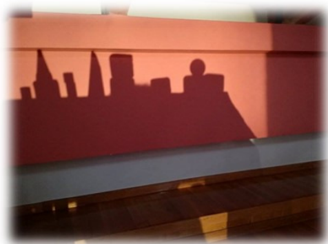
Εικόνα 6. Συγκρότηση της ιστορίας