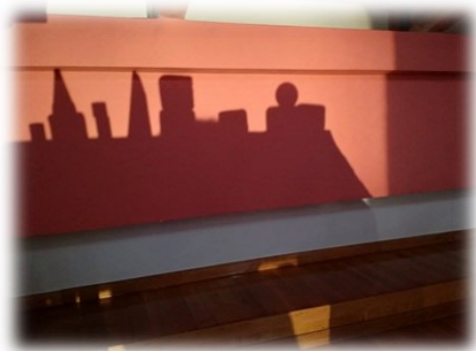
Εικόνα 6. Συγκρότηση της ιστορίας