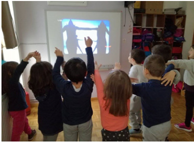
Εικόνα 2: Ο χορός των σκιών

Βήμα 3 ο : Ερώτημα: Μπορείς να κάνεις ό,τι κάνει η σκιά μου;