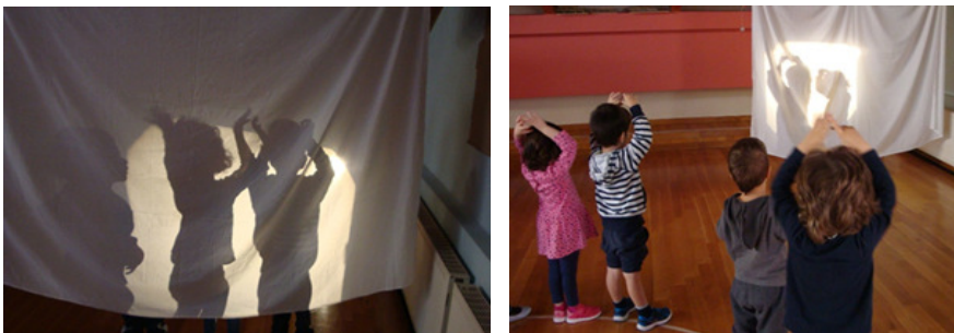
Εικόνα 3: Μίμηση των σκιών

Ο σκοπός αυτού του βήματος είναι η πρόκληση της δημιουργικότητας και της φαντασίας των παιδιών. Με αφορμή το εποπτικό υλικό που παρακολούθησαν τα παιδιά στο διαδραστικό πίνακα, δημιούργησαν το δικό τους θέατρο σκιών χρησιμοποιώντας πανιά, έναν προβολέα καθώς και τα σώματά τους ως σημείο αναφοράς (Εικόνα 3).