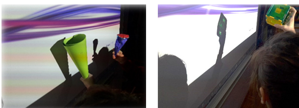
Εικόνα 4: Παιχνίδι με τις σκιές

Στα πλαίσια της ολομέλειας τα παιδιά, προσπάθησαν, πρώτα βιωματικά και έπειτα αλληλοεπιδρώντας με διάφορα αντικείμενα δικής τους επιλογής, να σχηματίσουν σκιές υπό το φως ενός σταθερού προβολέα (τεχνητή πηγή φωτός), καθώς και να αναγνωρίσουν τις μορφές αυτών των σκιών. Μεταξύ των αντικειμένων που επέλεξαν ήταν τα αναπτύγματα συγκεκριμένων γεωμετρικών στερεών όπως, του κύβου, του κυλίνδρου και του κώνου (Εικόνα 4).