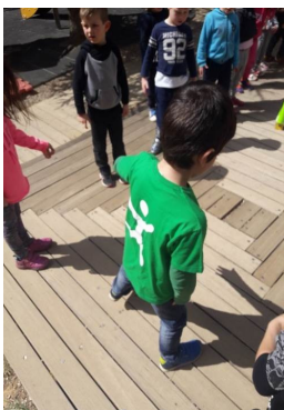
Εικόνα 1: Παρατήρηση της σκιάς

Με αφορμή το συγκεκριμένο ερώτημα τα παιδιά προέβησαν: στην παρατήρηση της σκιάς τους, στον πειραματισμό με το σώμα τους για τη δημιουργία σκιών, στην καταγραφή των προϋπαρχουσών εμπειριών που το κάθε παιδί είχε να καταθέσει για το φαινόμενο της σκιάς, σε διάλογο που αναπτύχθηκε μεταξύ των παιδιών για το πώς δημιουργούνται οι σκιές των αντικειμένων, για το πώς η εναλλαγή της θέσης τους στο χώρο σε σχέση με την φυσική πηγή του φωτισμού που είναι ο ήλιος δημιουργεί διαφορετικές μορφές σκιών στο έδαφος (Εικόνα 1).