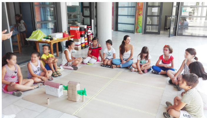
Εικόνα 2: Στιγμιότυπο από τη δράση που πραγματοποιήθηκε στο χώρο της Δανειστικής Βιβλιοθήκης Γρεβενών (Αύγουστος, 2016)

Αξίζει να σημειωθεί η σαφής έκφραση του θαυμασμού της παιδικής ομήγυρης για τα ψηλά κτίρια και τις πολυώροφες πολυκατοικίες, και γενικά για τις μεγάλες κλίμακες μεγεθών, αλλά ταυτοχρόνως και η παραδοχή πως «και τα χαμηλά κτίρια ωραία είναι». Ως εκ τούτου, διαφαίνεται η διάθεση των παιδιών να αποδεχτούν όλες τις όψεις που μπορεί να προσλάβει μία πόλη και να εκφραστούν εξίσου θετικά τόσο για το πυκνοκατοικημένο αστικό κέντρο όσο και για τα αραιοκατοικημένα προάστια/περίχωρα.