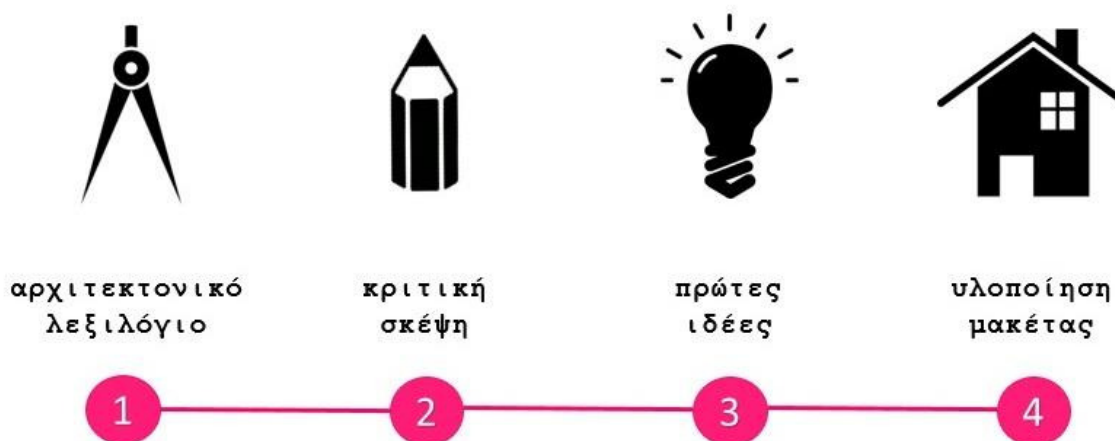
Εικόνα 1: Σχεδιάγραμμα δομής δράσης

Το Β΄ Μέρος περιλαμβάνει την ομαδική δράση «Αρχιτεκτονικό Εργαστήρι», δηλαδή την υλοποίηση σε μακέτα της φανταστικής πόλης των παιδιών. Ομοίως και το Β΄ Μέρος δομήθηκε σε δύο ενότητες: στην πρώτη ζητήθηκε από την παιδική συντροφιά να περιγράψει σε γενικές γραμμές την πόλη όπως ιδανικά τη φαντάζεται ενώ στη δεύτερη τα παιδιά παρέλαβαν τα υλικά και προχώρησαν στην κατασκευή σε μακέτα της φανταστικής/ιδανικής πόλης που προηγουμένως σκιαγραφήσανε προφορικά με τις εκφράσεις τους. Γενικά τα παιδιά έδειξαν εξίσου ευχάριστη διάθεση και στο Β΄ Μέρος, χαρακτηρίστηκαν από υψηλή ανταπόκριση, επέδειξαν δημιουργικότητα και φαντασία στην κατασκευή, διατύπωσαν ενίοτε προωθημένες απόψεις από αρχιτεκτονική σκοπιά ενώ, τέλος, στην ερώτηση των εμπνευστριών αν αισθάνθηκαν «μικροί αρχιτέκτονες / μικρές αρχιτεκτόνισσες» απάντησαν θετικά και με ενθουσιασμό.