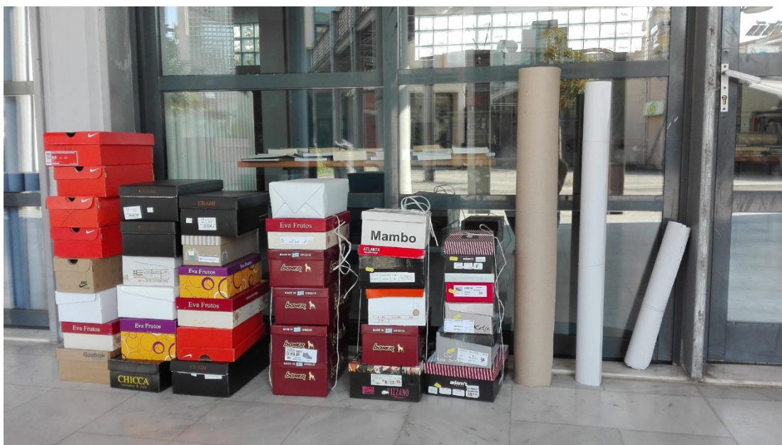
Εικόνα 3: Υλικά δράσης

Τα παραπάνω υλικά διατέθηκαν στα παιδιά και εξηγήθηκε ο τρόπος μορφοποίησής τους: