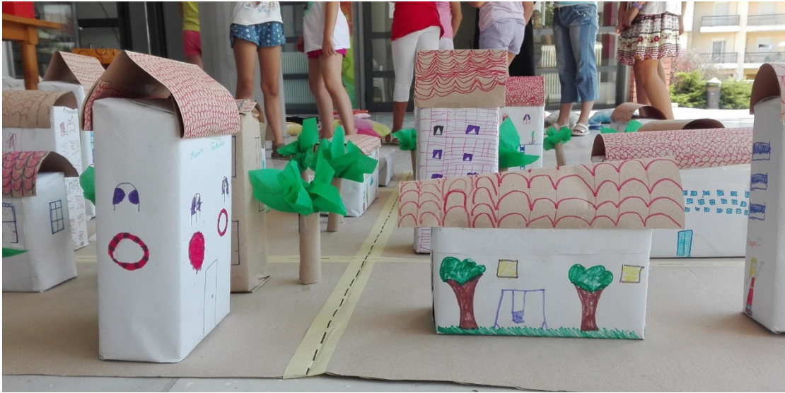
Εικόνα 5: Μακέτα φανταστικής πόλης που κατασκεύασαν τα παιδιά στη δράση που πραγματοποιήθηκε στο χώρο της Δανειστικής Βιβλιοθήκης Γρεβενών (Αύγουστος, 2016)