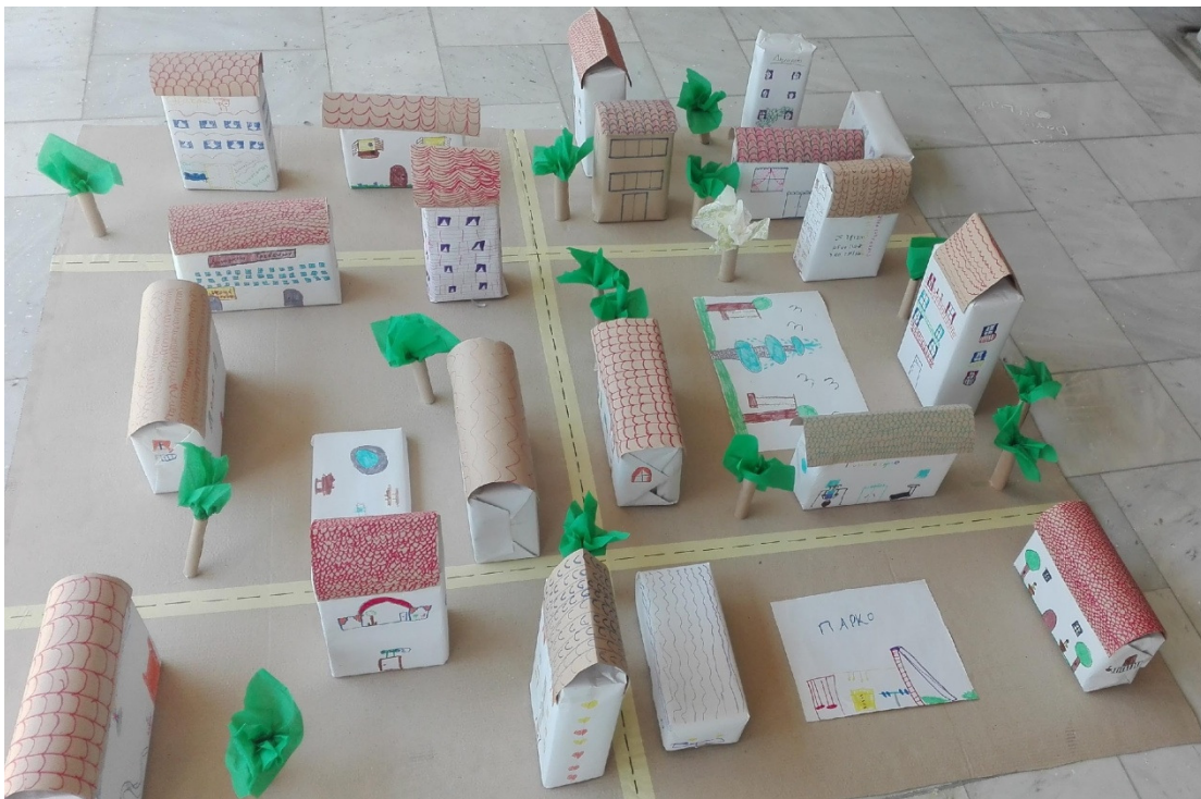
Εικόνα 6: Μακέτα φανταστικής πόλης που κατασκεύασαν τα παιδιά στη δράση που πραγματοποιήθηκε στο χώρο της Δανειστικής Βιβλιοθήκης Γρεβενών (Αύγουστος, 2016)