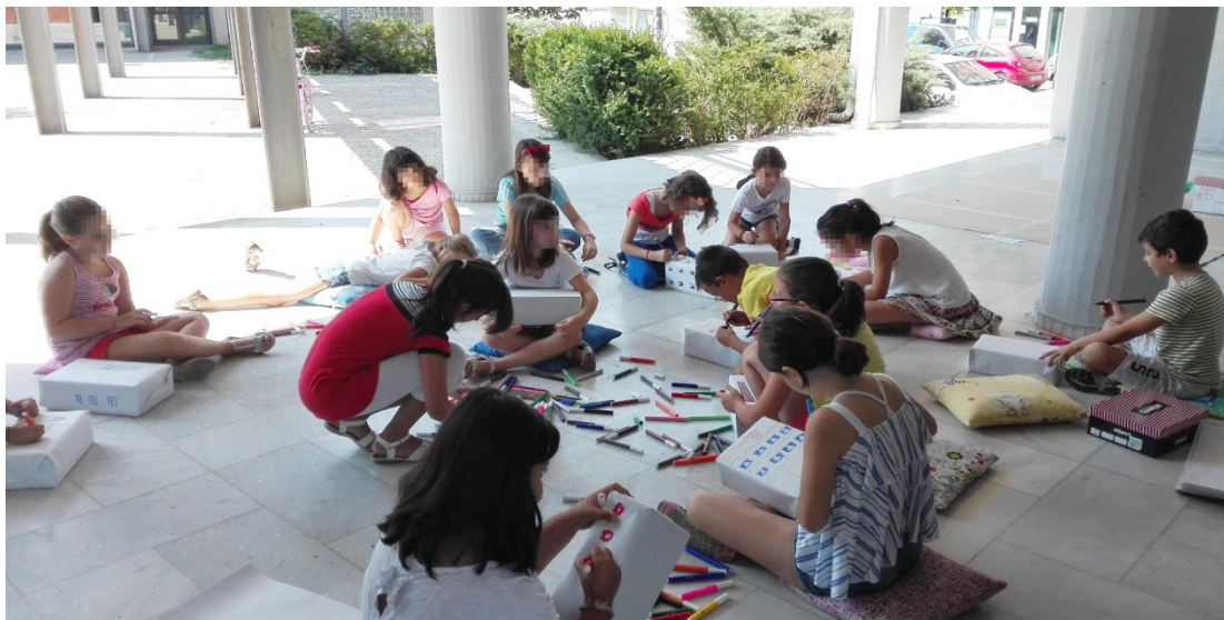
Εικόνα 4: Στιγμιότυπο από τη δράση που πραγματοποιήθηκε στο χώρο της Δανειστικής Βιβλιοθήκης Γρεβενών (Αύγουστος, 2016)