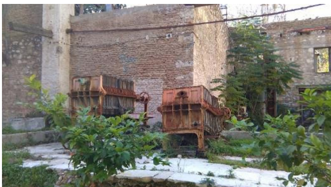
Εικόνα 4: Βιομηχανικά κατάλοιπα της ζυθοποιίας Μάμου, 11-2016. Συντεταγμένες λήψης 38.263860, 21.742053

σχέδιο πόλης. Σήμερα κάποια έχουν αναδειχτεί σε τοπόσημα, ευδιάκριτα και προφανή σημεία ενδιαφέροντος, με δεσπόζουσα την έξαρση της πλίθινης μισογκρεμισμένης καπνοδόχου τραυματισμένης πια από πρόσφατο σεισμό της Πάτρας.