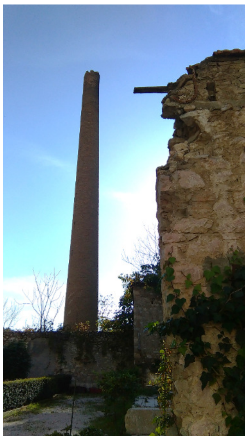
Εικόνα 5: Άποψη του εργοστασίου της Ζυθοποιίας Μάμου, 11-2016. Συντεταγμένες λήψης 38.264018, 21.741783

στον περιορισμένο χρόνο και χώρο, το εγχείρημα ξεπερνώντας ενδοιασμούς επιλογών, διαπράττεται και διεξάγεται εκτιμώμενο ανάλογα.