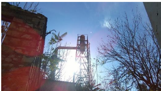
Εικόνα 6: Οπτικές φυγές στις διόδους μεταξύ των ακαλύπτων όπισθεν του δημοτικού σχολείου, 11-2016

Βάση της διεξαγωγής του παιχνιδιού είναι οι κανόνες, η τάξη που εξυφαινεται στην εξέλιξή του και νομιμοποιεί το τυχαίο και την ευθύνη αποδοχής του αποτελέσματος και των συνεπειών του.