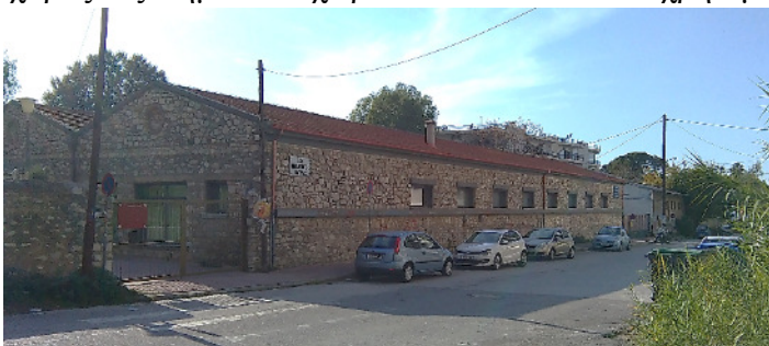
Εικόνα 1: Το 53 ο Νηπιαγωγείο Πατρών και η αίθουσα πολλαπλών χρήσεων του 64 ου Δημοτικού Σχολείου Πατρών στεγάζονται σε παλαιές αποθήκες της 5Ε, διαδόχου εταιρίας του Οίκου Άμβουργερ, 11-2016. Συντεταγμένες λήψης 38.264589, 21.741843

Στόχος της ομάδας μας είναι να ενσπείρουμε την αναζήτηση της ιστορίας του τόπου στο σχολείο της γειτονιάς και στους δημόσιους κοινόχρηστους χώρους γύρω του. Η έρευνα που παρουσιάζεται στοχεύει επίσης στη δυναμική 'αξιοποίηση' της παιδικής χαράς ως δημόσιου χώρου που δύναται να χρησιμεύσει για να εκπαιδευτούμε όλοι,