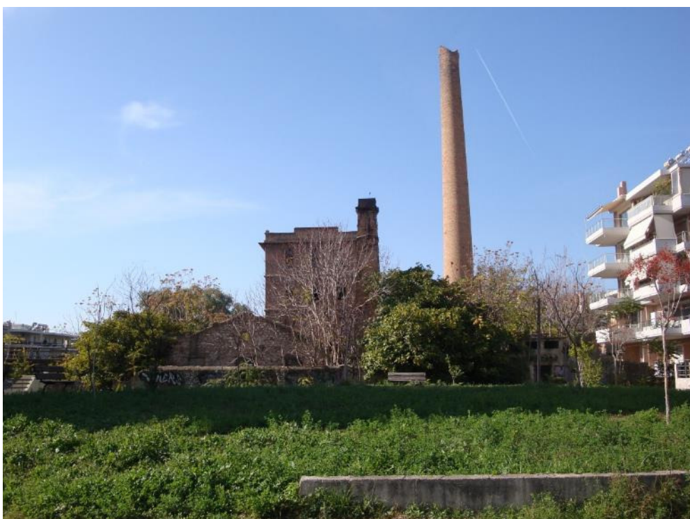
Εικόνα 3: Το εργοστάσιο της Ζυθοποιίας Μάμου, η ανατολική άποψη προς τις γραμμές του σιδηροδρόμου, 05-2016. Συντεταγμένες λήψης 38.263383, 21.742626