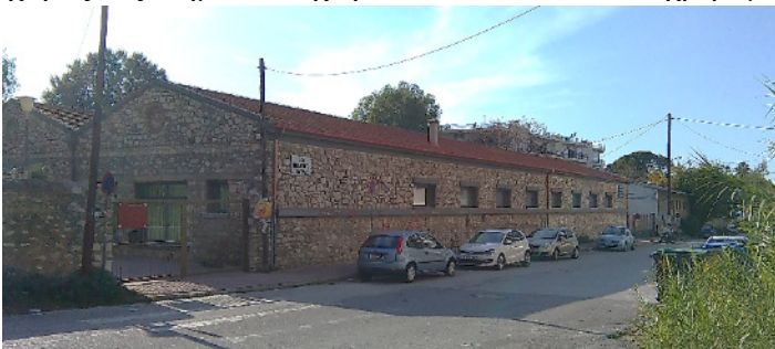
Εικόνα 1: Το 53 ο Νηπιαγωγείο Πατρών και η αίθουσα πολλαπλών χρήσεων του 64 ου Δημοτικού Σχολείου Πατρών στεγάζονται σε παλαιές αποθήκες της 5Ε, διαδόχου εταιρίας του Οίκου Άμβουργερ, 11-2016. Συντεταγμένες λήψης 38.264589, 21.741843

Στόχος της ομάδας μας είναι να ενσπείρουμε την αναζήτηση της ιστορίας του τόπου στο σχολείο της γειτονιάς και στους δημόσιους κοινόχρηστους χώρους γύρω του. Η έρευνα που παρουσιάζεται στοχεύει επίσης στη δυναμική 'αξιοποίηση' της παιδικής χαράς ως δημόσιου χώρου που δύναται να χρησιμεύσει για να εκπαιδευτούμε όλοι,