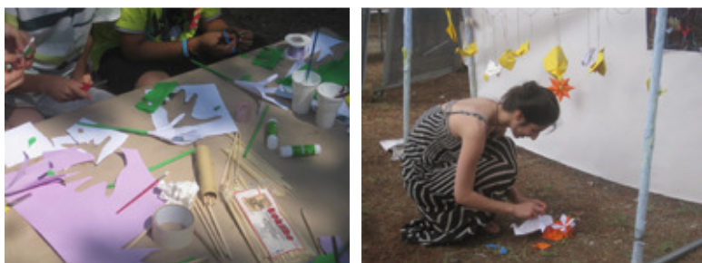
Εικόνες 5, 6: Εικαστικό εργαστήριο “ Κάν’ το όπως ο Πικάσο... ”

Οι φοιτητές αφού επέλεξαν τα έργα ζωγραφικής προσπάθησαν να εντοπίσουν και στη συνέχεια να αναδείξουν με τις δραστηριότητες τα σημαντικά στοιχεία του κάθε έργου. Για παράδειγμα στον πίνακα «Έναστρη Νύκτα» του Vincent Van Gogh οι «χαοτικές δίνες» μεταφέρθηκαν σε χρωματιστά χαρτόνια όπως και τα ψάρια από τους πίνακες του Paul Klee «Χρυσόψαρο» και «Fish magic» και μετουσιώθηκαν σε