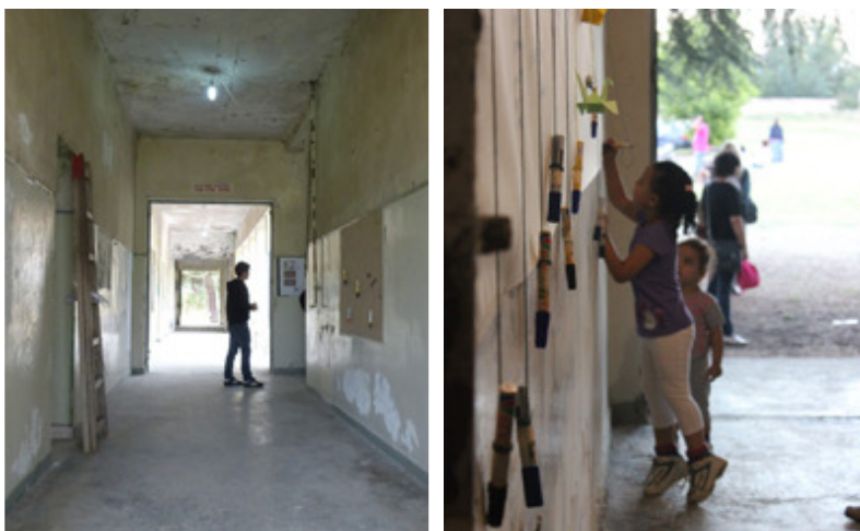
Εικόνες 1, 2: Το στρατόπεδο Παπαλουκά και η αξιοποίησή του από τα παιδιά

συγκεκριμένο χώρο στις αρχές του 20ου αιώνα. Μέσα στην έκταση του στρατοπέδου υπάρχει ένας σημαντικός αριθμός κτιρίων που είχαν κατασκευαστεί και χρησιμοποιούνταν για τις ανάγκες της λειτουργίας του ως στρατιωτικού χώρου (κοιτώνες, διοικητήριο, αποθήκες, κ.α.). Τα κτίρια αυτά ανήκουν σε διαφορετικές χρονικές περιόδους αλλά δεν υπάρχει ακριβής χρονολόγηση. Η διάκρισή τους γίνεται τόσο με βάση τα μορφολογικά και τυπολογικά τους χαρακτηριστικά όσο και από τον τρόπο δόμησής τους. Θεωρούνται σημαντικά δείγματα κτιριακών συνόλων στρατιωτικής αρχιτεκτονικής και αποτελούν κομμάτι του ιστορικού παρελθόντος της πόλης των Σερρών. Η επίσκεψη στο χώρο του στρατοπέδου θα μπορούσε να αποτελέσει αφορμή για να μιλήσει κανείς για την ιστορία της πόλης μέσα από τα ίχνη και τα διάφορα ιστορικά στρώματα που διακρίνονται στα κτίρια αλλά και στον περιβάλλοντα χώρο, αναδεικνύοντας τον ιδιαίτερο χαρακτήρα της πόλης των Σερρών. Στη σημερινή εποχή που οι υπαίθριοι χώροι στο κέντρο της πόλης σπανίζουν, το στρατόπεδο Παπαλουκά θα μπορούσε να φιλοξενήσει ένα πλήθος δράσεων, εφήμερων ή περιοδικών, όπως είναι τα παζάρια, οι θερινοί κινηματογράφοι, οι υπαίθριες θεατρικές παραστάσεις, οι εκθέσεις εικαστικού περιεχομένου και τα φεστιβάλ (Εικόνες