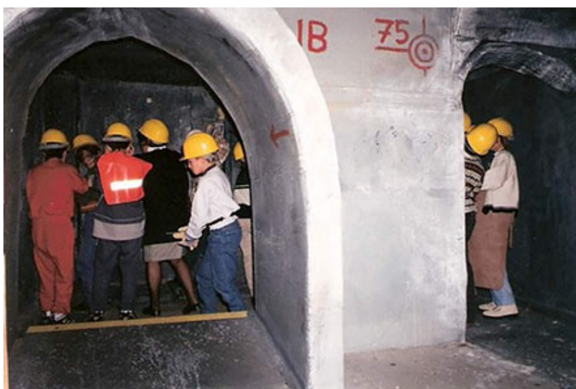
Εικόνα 2: Μέσα στη σήραγγα του εκθέματος ‘Εργο Μετρό’ του Ελληνικού Παιδικού Μουσείου

Πέρα από πολλούς επιμέρους γνωστικούς στόχους που εξυπηρετούν οι προαναφερθείσες ομάδες εκθεμάτων και έχουν τη δυνατότητα να συνδεθούν με κάθε πεδίο του αναλυτικού προγράμματος, όπως την τεχνολογία των υλικών, τη λογικομαθηματική σκέψη μέσα από τις ταξινομήσεις και τις εκτιμήσεις μεγεθών και χωρητικότητας ή τη γεωγραφία μέσα από τη γνωριμία με τροφές από διάφορες χώρες του πλανήτη στο τμήμα της αγοράς, το κέντρο βάρους αναμφίβολα πέφτει σε στόχους κοινωνικής μάθησης. Η εύρυθμη συλλογική ζωή μέσα στην πόλη απαιτεί καλή επικοινωνία, συνεργασία, σωστές αποφάσεις για το κοινωνικό σύνολο, υπευθυνότητα για την εργασία που αναλαμβάνει ο καθένας. Έτσι η πόλη-προσομοίωση δίνει την ευκαιρία στα παιδιά όχι μόνο να εξοικειωθούν και να κατανοήσουν πρακτικά ζητήματα της καθημερινής ζωής στην πόλη, αλλά και να βιώσουν την αξία της συλλογικότητας.