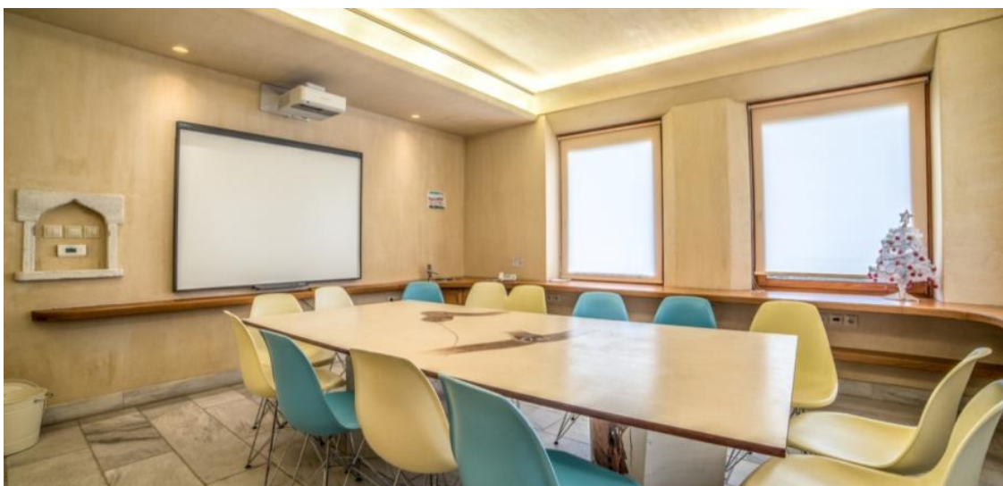
Εικόνα 4: Τυπική αίθουσα εκπαιδευτηρίου

Οι αίθουσες διδασκαλίας (Εικόνα 4) λειτουργούν πολυδιάστατα δίνοντας δυνατότητα εναλλακτικών θέσεων των μαθητών και του δασκάλου με την ελεύθερη τοποθέτηση καθισμάτων και τα περιμετρικά ράφια-πάγκους εργασίας. Σε όλες τις αίθουσες ο διαδραστικός πίνακας βρίσκεται σε σταθερή κυρίαρχη θέση, ενώ παράλληλα γυάλινοι πίνακες στις άλλες πλευρές της αίθουσας εξισορροπούν τη σημασία των τοίχων.