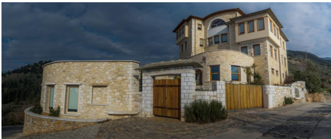
Εικόνα 1: Εξωτερική άποψη συγκροτήματος- Κεντρική είσοδος

Το «Άξιον εστί» (Εικόνα 1) είναι ένα συγκρότημα εκπαίδευσης και ψυχαγωγίας το οποίο βρίσκεται στο όριο του αστικού ιστού, εκεί που οι ήχοι της πόλης εξαχνίζονται, στους πρόποδες του Πηλίου, σε μια πλαγιά με πανοραμική θέα προς το λιμάνι και την πόλη του Βόλου.