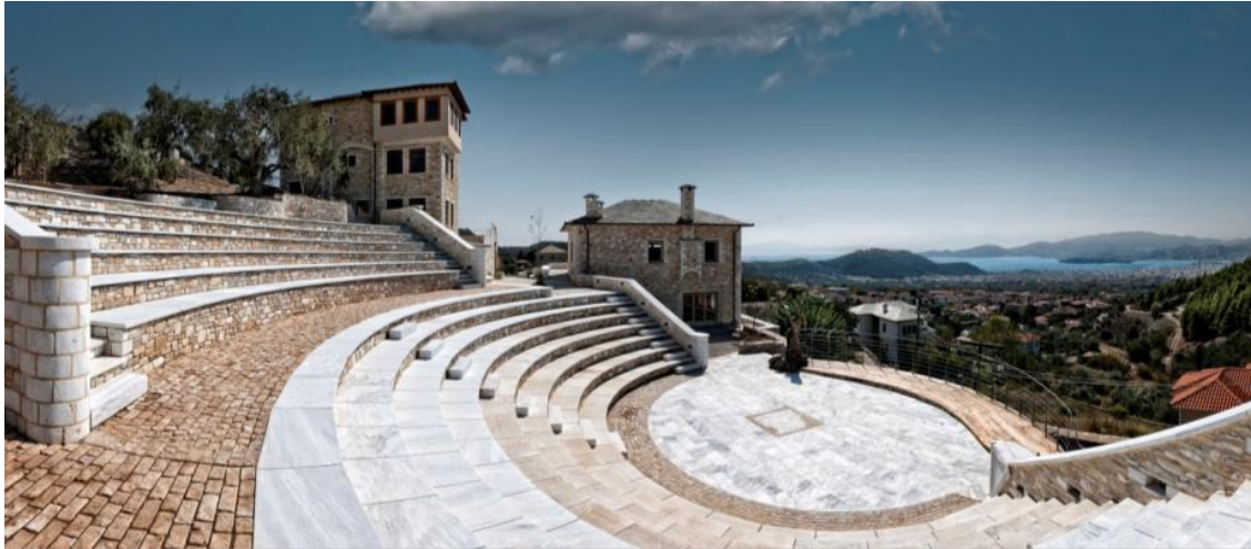
Εικόνα 2: Το υπαίθριο αμφιθέατρο

Η διαμόρφωση του εξωτερικού χώρου, στοχεύοντας στο να διδάξει μέσα από την επαφή των μαθητών με τη βιοποικιλότητα της φύσης, περιλαμβάνει το «μονοπάτι ρεφλεξολογίας» που συνδέει τα διάφορα «γεγονότα-παιχνίδια», όπως βοτανόκηπους, τοίχους αναρρίχησης και ξύλινες κατασκευές. Η «ατέρμονη πορεία του νερού» ζωντανεύει τα φυσικά φαινόμενα και μετατρέπει το προαύλιο του σχολείου σε ένα υπαίθριο εργαστήριο για την κατανόηση των ασκήσεων φυσικής.