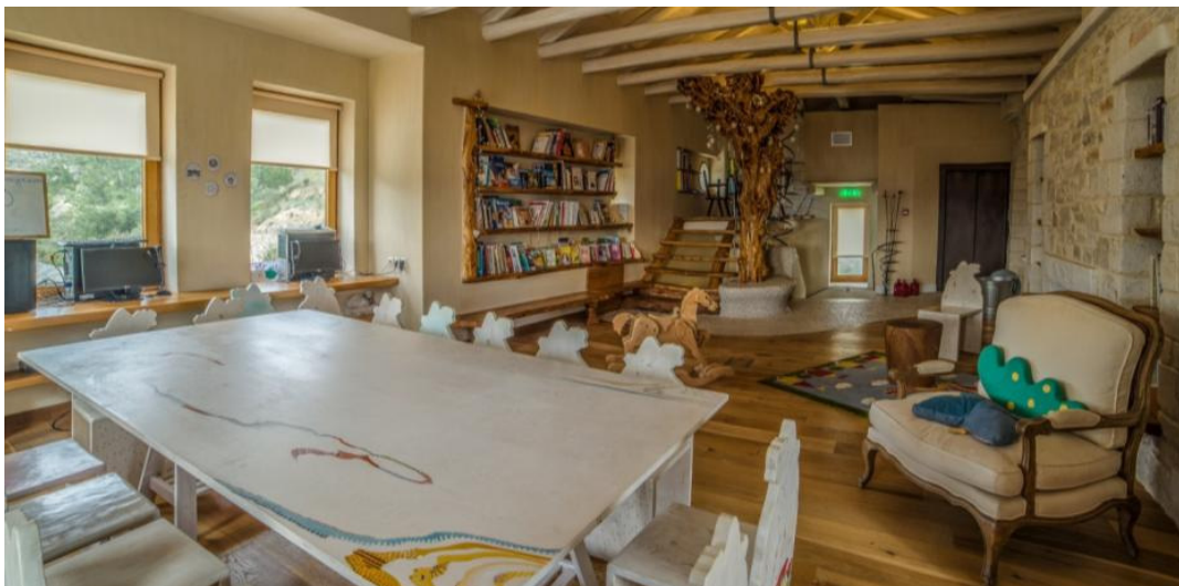
Εικόνα 5: Η βιβλιοθήκη

Ειδικότερα, η πολυδυναμική αίθουσα φυσικής-χημείας-μαγειρικής διαθέτει προσδιορισμένο ασφαλές χώρο πειραμάτων. Το εργαστήριο σαν να έχει ξεπροβάλει από τις εικονογραφήσεις των παραμυθιών αποτελεί έναν οικείο χώρο ο οποίος τροφοδοτεί τη φαντασία των παιδιών για νέες εξερευνήσεις. Η βιβλιοθήκη (Εικόνα 5) ανοιχτή και εύκολα προσπελάσιμη βοηθάει στην εξοικείωση των μαθητών με το βιβλίο και ενισχύει τη φιλιαναγνωσία τους. Η εναλλακτική αίθουσα μουσικής βρίσκεται στην αγκαλιά της στέγης. Η ανοιχτή αίθουσα εικαστικών αποτελεί μια καινοτομία αλληλεπίδρασης και γνωριμίας με κάθε καλλιτεχνική δημιουργία. Η αίθουσα χορού εξυπηρετεί τις συμπληρωματικές δραστηριότητες της εκπαιδευτικής διαδικασίας.