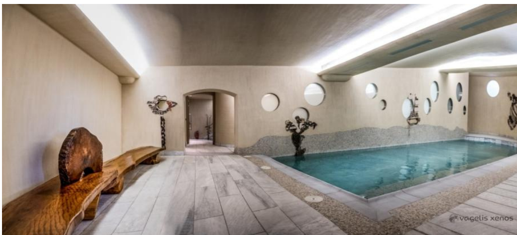
Εικόνα 6: Η εσωτερική πισίνα

Ο δεύτερος πυρήνας είναι αυτός της ψυχαγωγίας , φιλοξενείται στο δεύτερο κτίριο του συγκροτήματος και περιλαμβάνει τις επιπρόσθετες υποδομές για τη λειτουργία του πολυχώρου. Στον όγκο αυτό βρίσκονται το αναμυκτήριο-κυλικείο για τους μαθητές και ο χώρος του καφέ για τους γονείς και τους εκπαιδευτικούς. Στον κάτω όροφο, με ανεξάρτητη είσοδο, αναπτύσσεται η αίθουσα πολλαπλών χρήσεων που ανοίγει στη σκηνή του υπαίθριου αμφιθεάτρου. Στη χαμηλότερη στάθμη του κτιρίου βρίσκεται η εσωτερική πισίνα (Εικόνα 6).