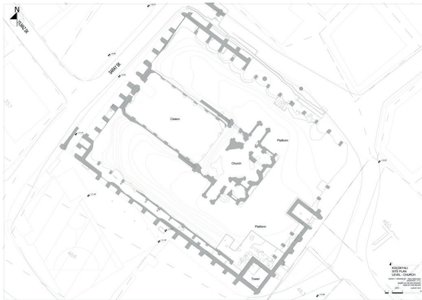
Plan of the archaeological site at Küçükyaalı (KYAP, 2011)

The presentation proposes to discuss the architectural features of the single buildings excavated thus far, their chronology, organization and function. Emphasis will also be placed on the significance of this discovery within the rather modest panorama of surviving 9th-century ecclesiastical buildings and monastic complexes in the city of Constantinople.