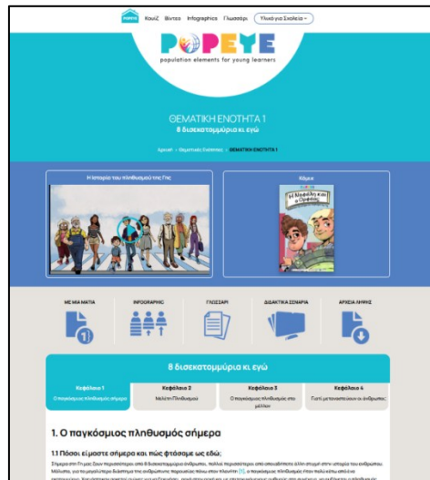
Σχήμα 2: Θεματική Ενότητα 1