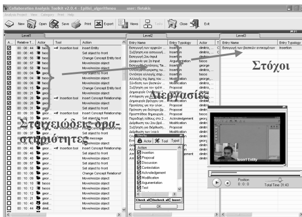
Εικόνα 1. Πολυεπίπεδη αναπαράσταση της δραστηριότητας μέσω CoIAT.

Μία σημαντική δυνατότητα που παρέχει το CoIAT σχετίζεται με τη δυνατότητα δημιουργίας μιας ιεραρχικής δομής περιγραφής της ανθρώπινης (ατομικής ή συλλογικής) δραστηριότητας που ανταποκρίνεται στην προσέγγιση της Θεωρίας Δραστηριότητας (Leontie'v, 1978). Αυτό σημαίνει ότι ο παρατηρητής έχει τη δυνατότητα να μελετήσει μια σειρά από στοιχειώδεις δραστηριότητες, να τις σχολιάσει και να χτίσει ένα υψηλότερο, πιο γενικό και αφηρημένο επίπεδο περιγραφής τους. Το επίπεδο αυτό που είναι το δεύτερο στην ιεραρχία ονομάζεται και Task Level (που αφορά στην ενσυνείδητη δράση του υποκειμένου που καθοδηγείται από συγκεκριμένους στόχους). Ένα τρίτο επίπεδο που είναι και το υψηλότερο ιεραρχικά ονομάζεται Goals Level και περιγράφει τους γενικότερους στόχους που έχει θέσει το υποκείμενο ή τα υποκείμενα.