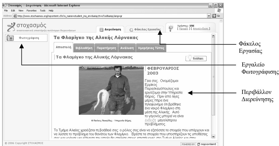
Σχήμα 1. Το διαδικτυακό περιβάλλον μάθησης ΣΤΟΧΑΣΜΟΣ.