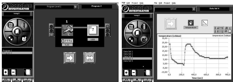
Εικόνα 3. Αριστερά: το πρόγραμμα των μαθητών για τη λήψη των μετρήσεων, Δεξιά: Τυπικές μετρήσεις από την εργασία των μαθητών κατά τη διάρκεια του πειράματος.

Μετά το τέλος του πειράματος και παρατηρώντας τις καταγεγραμμένες θερμοκρασίες στην οθόνη του υπολογιστή δόθηκε η ευκαιρία για συζήτηση με τον ερευνητή για θέματα που αφορούσαν την αιτία και τον τρόπο μεταφοράς της θερμότητας από το ένα σώμα στο άλλο, τη σχέση της θερμότητας με τη θερμοκρασία και το φαινόμενο της τήξης του πάγου.