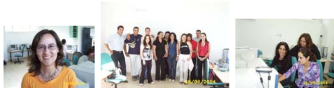
Σχήμα 1: Εκπαιδεύτρια και εκπαιδευόμενοι στο εργαστήριο Πληροφορικής

νέες τεχνολογίες. Η χρήση και η διάδοση τους έχουν εισέλθει σε πολλούς, διαφορετικούς τομείς των ανθρώπινων δραστηριοτήτων επηρεάζοντας τις.