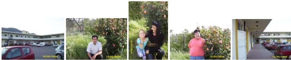
Σχήμα 2: Εκπαιδευόμενοι στο χώρο του σχολείου

Τόσο στο δεύτερο όσο και στα υπόλοιπα δώρα έκαναν λήψεις φωτογραφιών μέσα στην αίθουσα του εργαστηρίου Πληροφορικής, στον κήπο, την αυλή και τον ευρύτερο χώρο του σχολείου. Στη συνέχεια εισήγαγαν τις επιλεγμένες φωτογραφίες στο κείμενο τους και ολοκλήρωσαν την εργασία τους με τις τελικές μορφοποιήσεις.