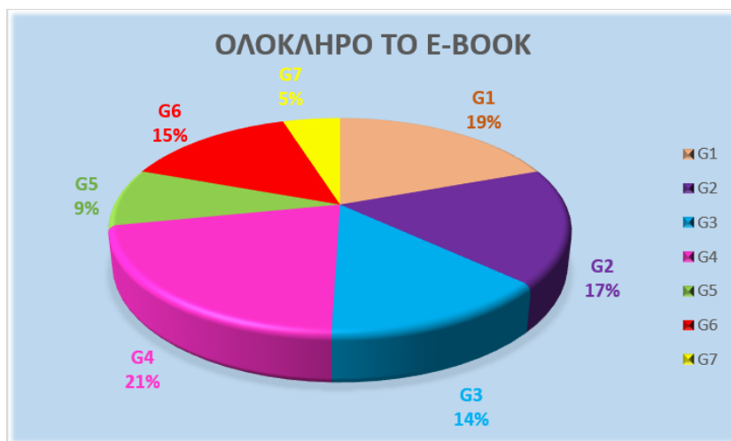
Σχήμα 1. Όψεις της φύσης των φυσικών επιστημών που ενεργοποιούνται στο e-book

Στα σχήματα που ακολουθούν παρουσιάζονται τα αποτελέσματα της ανάλυσης με το μοντέλο GNOSIS όλου του αλληλεπιδραστικού διαδικτυακού βιβλίου συμπεριλαμβανομένου της βασικής ροής, του ενθέτου, των βίντεο και των δραστηριοτήτων. Κάθε κομμάτι του βιβλίου (κείμενο, βίντεο, δραστηριότητες, ένθετο) αναλύθηκε ξεχωριστά με βάση ποια ή ποιες όψεις της φύσης των φυσικών επιστημών (G1-G7) ενεργοποιεί συνθέτοντας διαγράμματα ροής. Τα διαγράμματα ροής μετατράπηκαν σε πίτες (γραφήματα) ώστε να απεικονίζονται ποσοστιαία οι όψεις ενεργοποίησης της φύσης των φυσικών επιστημών. Στο 2 ο Σχήμα οι όψεις έχουν κατηγοριοποιηθεί με βάση τη διάσταση που ενεργοποιούν βάσει του μοντέλου GNOSIS.