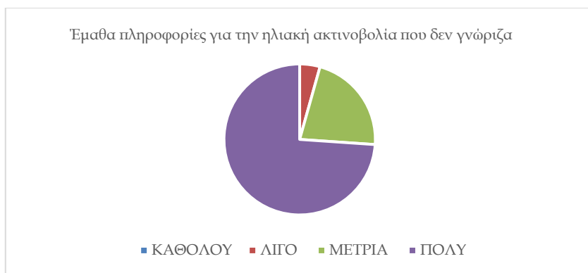
Σχήμα 3. Εκμάθηση νέων πληροφοριών από τους μαθητές