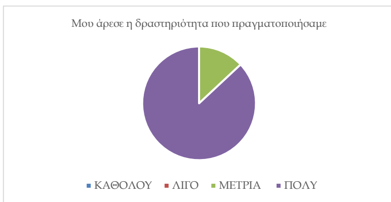
Σχήμα 2. Ερώτηση σχετικά με την δραστηριότητα