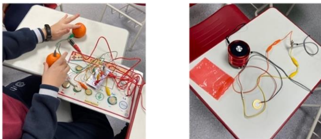
Εικόνα 2. Κατασκευή α) μουσικού οργάνου με αγωγήματα υλικά, β) μικρόφωνου και υδρόφωνου

Αναφορικά με τις πρακτικές μουσικής παραγωγής, οι δραστηριότητες έδιναν έμφαση στη δημιουργία μουσικών συνθέσεων, τη διασκευή κομματιών, αλλά και τη σύνθεση μουσικής για βίντεο. Αξιοποιήθηκε το Bandlab ως DAW. Αρχικά, οι δράσεις εστίαζαν στις δυνατότητες του λογισμικού με βιωματικό τρόπο και μέσα από πειραματισμό για τη δημιουργία μικρών συνθέσεων, ενώ σταδιακά επικεντρώνονταν σε αυθεντικά σενάρια –π.χ., διασκευή, μουσική για βίντεο – σε ατομικό και ομαδικό επίπεδο. Σχετικά με τις κατασκευές τεχνουργημάτων, τα παιδιά ενεπλάκησαν σε δράσεις για την κατασκευή ψηφιακών μουσικών οργάνων και τεχνουργημάτων με τη χρήση της διεπαφής Makey Makey και αγωγήματα υλικά –π.χ., κέρματα, φρούτα, νερό, αλουμινόχαρτο . Ακόμα, κατασκεύασαν τα δικά τους μικρόφωνα και υδρόφωνα, με τα οποία ηχογράφησαν ήχους που αξιοποίησαν δημιουργικά στις μουσικές τους συνθέσεις (βλ. εικόνα 2). Οι πρακτικές κωδικοποίησης αφορούσαν στη χρήση μουσικού προγραμματισμού, μέσω της αξιοποίησης της γλώσσας οπτικού προγραμματισμού Scratch. Οι μαθητές δημιούργησαν μουσικές εφαρμογές –π.χ., μουσικά παιχνίδια, εικονικά όργανα –, αλλά και μουσικές συνθέσεις ή διασκευές με χρήση κώδικα. Παράλληλα, δημιούργησαν τμήματα κώδικα τα οποία προγραμμάτιζαν τις διεπαφές από τα μουσικά τεχνουργήματα.